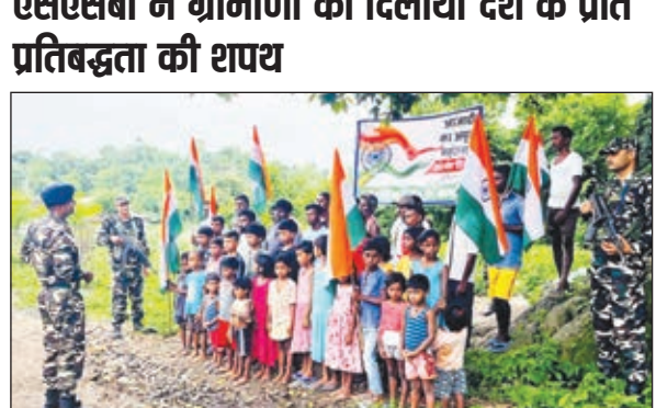
बच्चों को देशभक्ति की शपथ दिलाते एसएसबी के जवान।