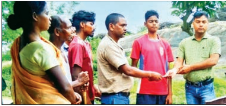
घायलों के आश्रित को अग्रिम मुआवजे की राशि प्रदान करते वन विभाग के अधिकारी।