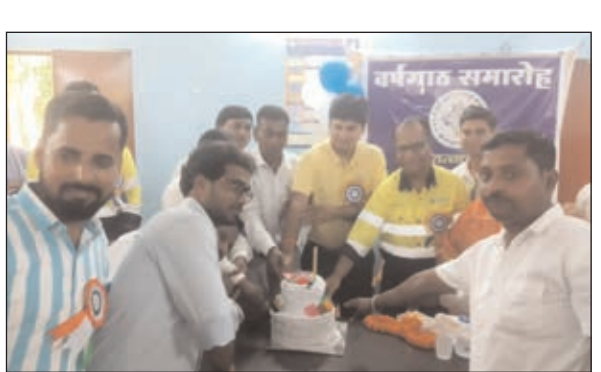
केक काटकर वर्षगांठ मनाते समाज के लोग।