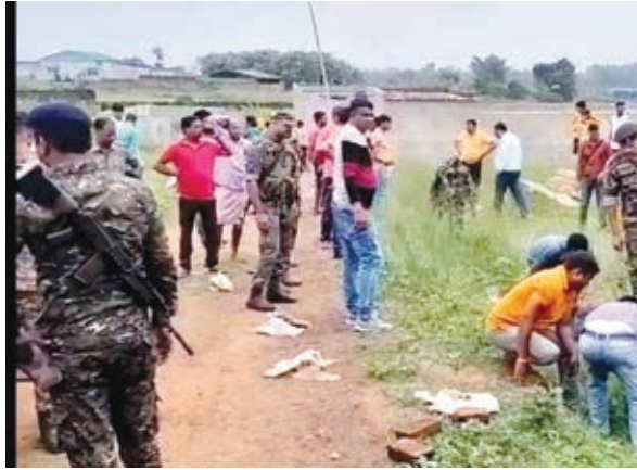
घटनास्थल पर खानबीन करती पुलिस ।