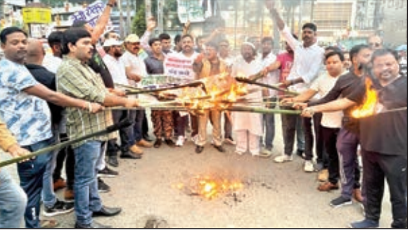
पुतला दहन कर विरोध प्रदर्शन करते समाज के लोग।