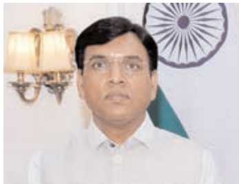
डॉ. मनसुख मंडाविया