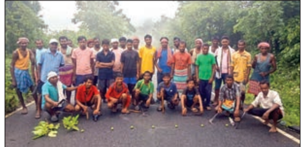
झाड़ियों की कटाई करने वाले वन सुरक्षा समिति के सदस्य।