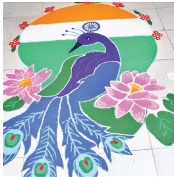
रांची विश्वविद्यालय के आर्यभट्ट ऑडिटोरियम में बनायी गयी एक रंगोली।