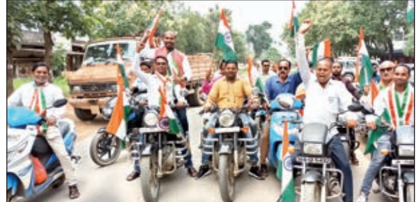
अनगड़ा में तिरंगा यात्रा निकालते भाजपा मंडल के सदस्य।