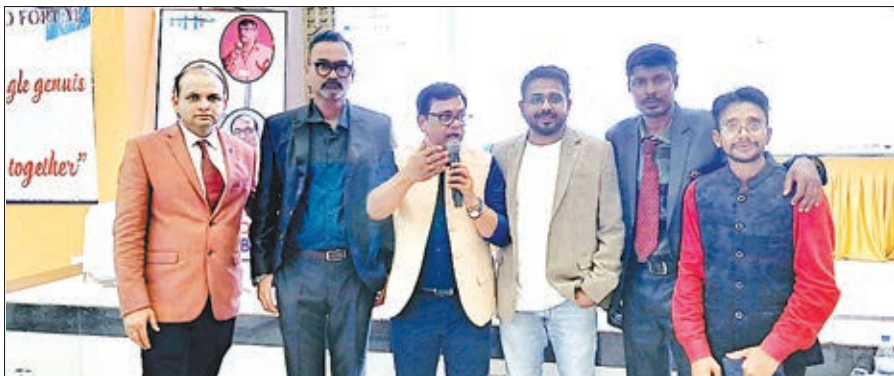
सेमिनार में भाग लेते होमियोपैथिक चिकित्सक।