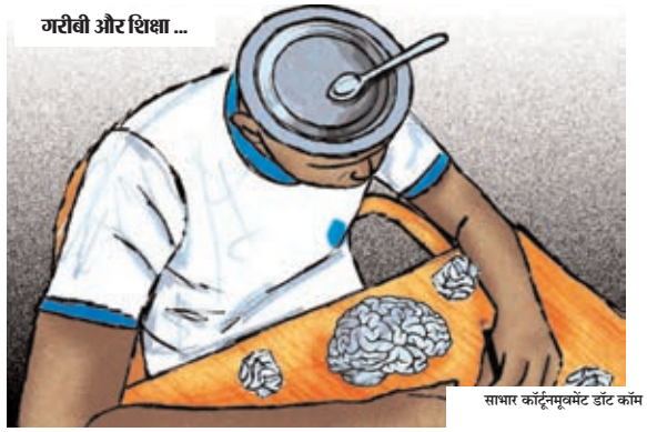
सामर कॉर्टनयुवक डॉक्टर का काम