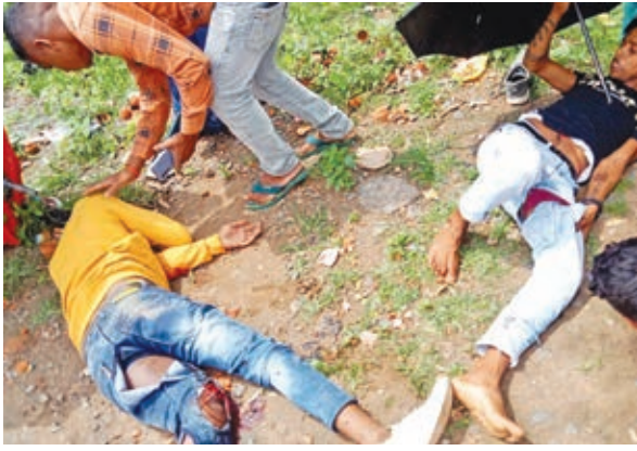
गोलीबारी में मृतक और घायल ।

पिस्टल ऊपर कर दिया। जिसकी वजह से कई लोगों की जान बच गई। घटनास्थल पर पहुंची पुलिस ने कई गाड़ियां और हथियार जब्त किए हैं। आक्रोशित ग्रामीणों ने भूमि विवाद में गोली चलाने वाले पक्ष की गाड़ियों को क्षतिग्रस्त कर दिया था। एसपी ने बताया कि गाड़ियों के मालिक और भूमि विवाद में गोली चलाने वाले पक्षकारों के नामों का सत्यापन किया जा रहा है। जल्द ही उनको गिरफ्तार किया जाएगा।