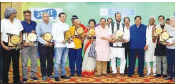
स्पर्श लाइफटाइम अचीवमेंट अवार्ड से सम्मानित लोग।