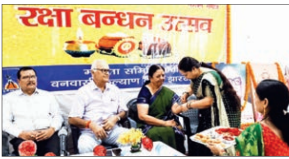
एकल विद्यालय में रक्षाबंधन उत्सव मनाया गया।