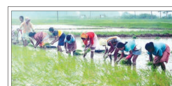
किसानों ने रोपा तेज किया : पिछले कुछ दिनों से हो रही बारिश से किसानों को थोड़ी राहत मिली है। राज्यभर में पूरे जोर-शोर से धान की खेती की जाने लगी है। परिणाम है कि पूरे जून-जुलाई में राज्य में जितनी धान की खेती नहीं हुई थी, बीते सात दिनों में उससे ज्यादा रोपनी हुई है। राज्य में अब तक करीब 3.18 मिली बारिश हो गयी है। मानसून के रफ्तार पकड़ने से किसानों ने राहत की सांस ली है।

रांची। राज्य में पिछले कुछ दिनों से लगातार बारिश हो रही है। बारिश के कारण राज्यभर में पूरे जोर-शोर से धान की खेती की जाने लगी है। परिणाम है कि पूरे जून-जुलाई में राज्य में जितनी धान की खेती नहीं हुई थी, बीते सात दिनों में उससे ज्यादा रोपनी हुई है। मौसम विभाग के अनुसार पिछले 24 घंटे में राजधानी में 6.1 एमएम बारिश रिकॉर्ड किया गया। सबसे अधिक वर्षा 73 मिमी लोहरदगा के कुडू में दर्ज की गयी। सिमडेगा 50 एमएम जमशेदपुर में 6 मिमी बारिश दर्ज की गयी। (शेष पेज 11 पर)