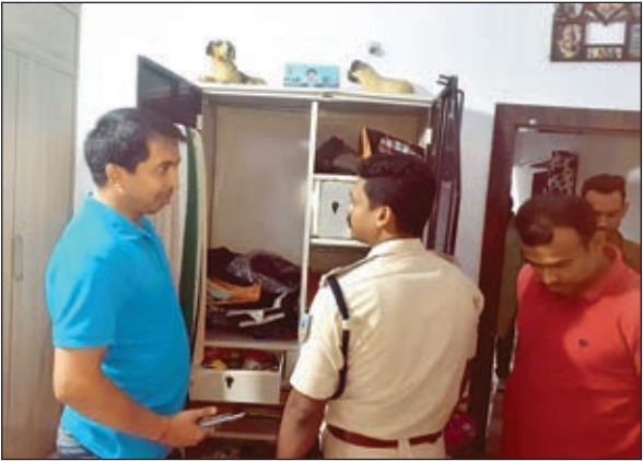
जांच करने पहुंची पुलिस