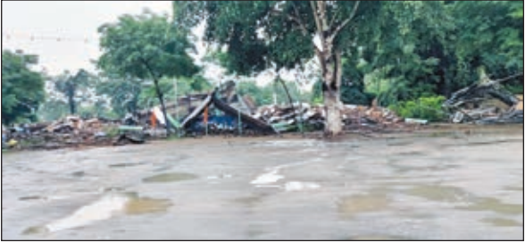
हटाया गया अतिक्रमण