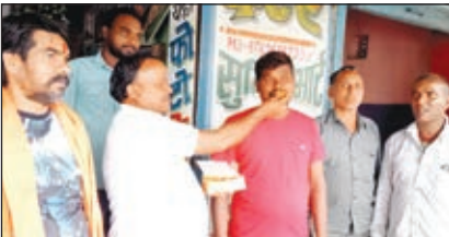
मिताई खिलाकर खुशी मनाते कार्यकर्ता ।