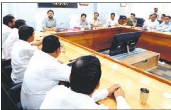
बैठक में उपस्थित पदाधिकारी व जनप्रतिनिधि ।

लातेहार। स्वतंत्रता दिवस समारोह की तैयारी को लेकर समाहरणालय सभागार में उपयुक्त हिमांशु मोहन की अध्यक्षता में बैठक आयोजित की गई। उपयुक्त ने कहा कि स्वतंत्रता दिवस हमारा राष्ट्रीय पर्व है। स्वतंत्रता दिवस हर्षोल्लास एवं धूमधाम के साथ मनाया जाएगा। स्वतंत्रता दिवस के अवसर पर विभिन्न कार्यक्रम आयोजित किये