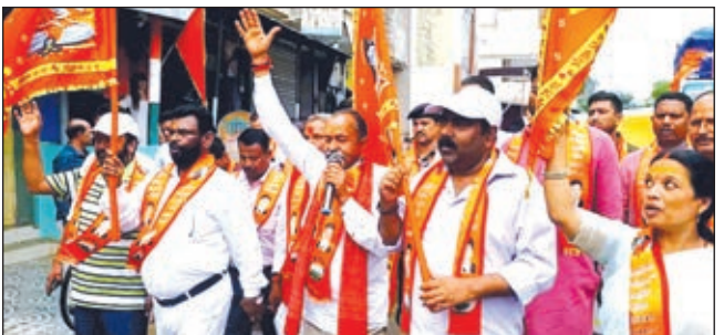
देवघर के लिए रवाना होता जत्था ।