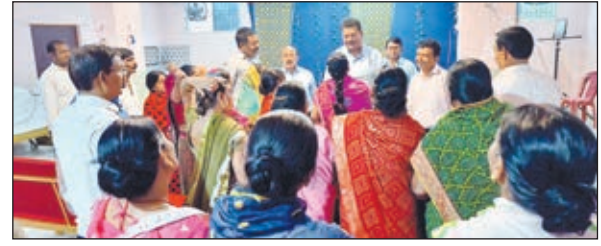
सदर विधायक व अन्य