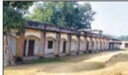
श्रीश्री माँ उग्रतारा विद्यालय ।

ने बताया कि विद्यालय में 450 विद्यार्थी नामांकित है। पूरे विद्यालय परिसर में चहारदीवारी नहीं है। वर्ष 1985 से विद्यालय संचालित हो रहा है, लेकिन मूलभूत सुविधाओं की कमी है। चारदीवारी के अभाव में विद्यालय बंद होने के बाद भी यहां असामाजिक तत्वों का अड्डा जमा रहता है। विद्यालय के कमरे भी असुरक्षित है। उन्होंने शिक्षा