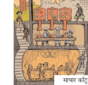
साभार कार्टूनमूवमेंट डॉट काम