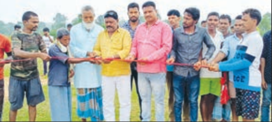
टूर्नामेंट का उद्घाटन करते लोग ।