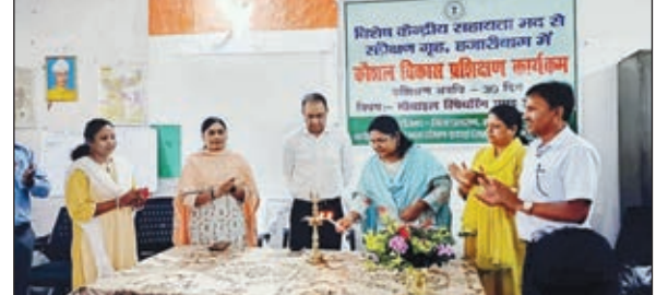
कार्यक्रम में मुख्य अतिथि व अन्य