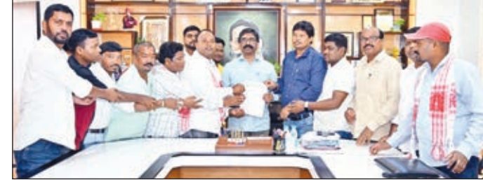
सीएम को महोत्सव में शामिल होने का न्यौता देते केंद्रीय सरना समिति के लोग।

रांची। मुख्यमंत्री हेमंत सोरेन ने कहा कि झारखंड आदिवासी महोत्सव 2023 को इस बार एक अलग पहचान मिलेगी। देशव्यापी प्रचार-प्रसार के कारण देश-दुनिया से इस महोत्सव में शामिल होने के लिए लोग आ रहे हैं। यह बहुत ही खुशी की बात है। आदिवासी परंपरा, कला-संस्कृति, रहन-सहन, आदिवासी उत्पाद और गीत-संगीत-नृत्य को संरक्षित और आगे बढ़ाने की दिशा में उनकी सरकार लगातार प्रयास कर रही है। उन्होंने कहा, आदिवासी कला-संस्कृति को संरक्षित