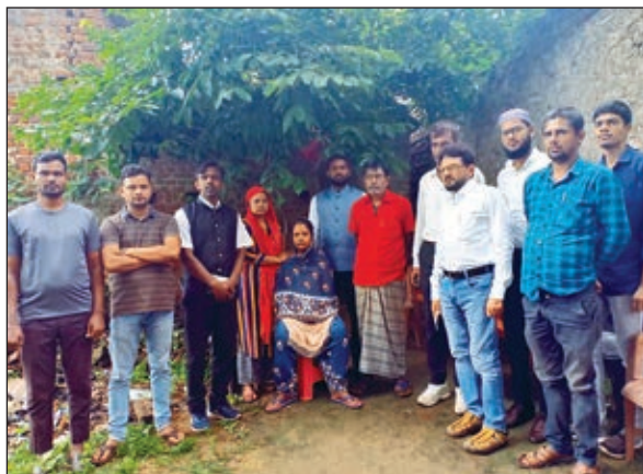
मृतक के परिजनों से मिलते