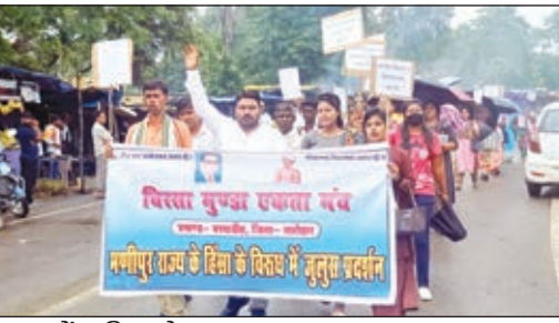
जुलूस में शामिल लोग ।