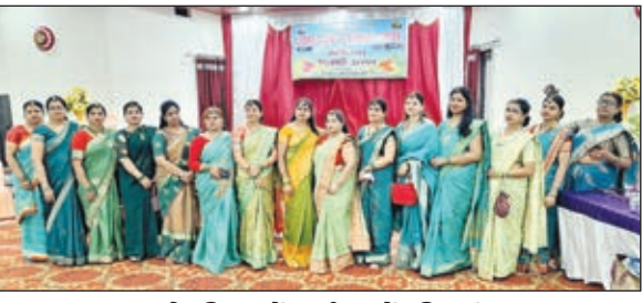
हरे परिधान में कार्यक्रम में महिलाएं

पारंपरिक हरे रंग की वेशभूषा में बड़ी संख्या में लाइन परिवार की महिलाएं समारोह में शामिल हुईं। इस समारोह के कई आकर्षण कार्यक्रम शामिल थे जिन्में से एक था 'सजा हुआ झूला' फोटोशूट यह सभी उपस्थित जनों को हरे भरे परिवेश और मानसूनी माहौल के