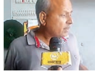
घटना की जानकारी देते दुकानदार।