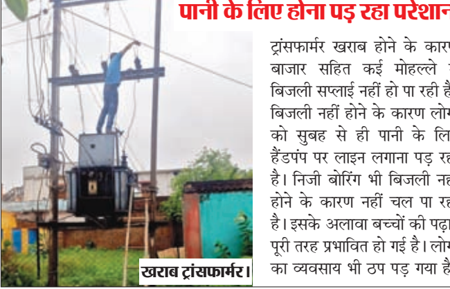
पानी के लिए होना पड़ रहा परेशान

ट्रांसफार्मर खराब होने के कारण बाजार सहित कई मोहल्ले में बिजली सप्लाई नहीं हो पा रही है। बिजली नहीं होने के कारण लोगों को सुबह से ही पानी के लिए हैंडपंप पर लाइन लगाना पड़ रहा है। निजी बोरिंग भी बिजली नहीं होने के कारण नहीं चल पा रही है। इसके अलावा बच्चों की पढ़ाई पूरी तरह प्रभावित हो गई है। लोगों का व्यवसाय भी ठप पड़ गया है।