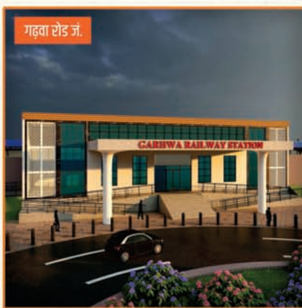
गढ़वा रोड जं.