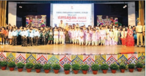
'वात्सल्यम' कार्यक्रम के मौके पर बच्चे।

सांस्कृतिक कार्यक्रम की शुरुआत श्लोकोच्चारण तथा दीप प्रज्वलन के साथ हुई। इसके बाद स्वागत गीत प्रस्तुत किया गया, जिसमें धरती माता की उदारता का आनंद लेने के लिए प्राकृतिक संसाधनों के संरक्षण का संदेश दिया गया। बच्चों ने मंच पर एक्वेटिक मैलोडीज कार्यक्रम की प्रस्तुति दी, जिसमें जल संरक्षण की आवश्यकता को दर्शाया गया। बैकग्राउंड टू द पन्चर के माध्यम से यह संदेश दिया गया कि अगर हम