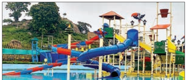
वाइल्ड वादी वाटर पार्क में मौजूद सुविधाएं।

स्पिन राइड, रोप कोर्स, गो गो साइकल, चिल्ड्रन बोट आदि जैसे वाटर स्पोर्ट्स का आनंद उठा सकते हैं। लोगों ने वाटर पार्क को बहुत पसंद किया है। आज लोग यहां झारखंड के कोने-कोने से मनोरंजन करने आ रहे हैं। यहां आने वाले सभी पर्यटकों को टिकट के अलावा कॉन्स्ट्र्यूम, लॉकर और पार्किंग जैसी सुविधा बिल्कुल मुफ्त दी जा रही है। साथ ही, पार्क के अंदर ही फैमिली पिकनिक मना सके, उसके लिए भी व्यवस्था की जा रही है। उन्होंने कहा- मैं आप सभी से अपील करता हूँ कि बड़ी संख्या में वाटर पार्क आएं और ऑफर का लाभ उठावें।