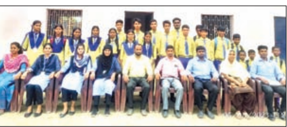
बाल संसद में शामिल विद्यार्थियों के साथ शिक्षकगण।