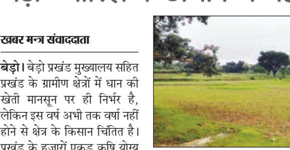
बड़ो में बारिश के अभाव में सूखा पड़ा खेत।

गांव के कुंआ व तालाब अभी तक सूखे ही हैं। वर्षा के कमी को लेकर खेतों की तैयारी भी नहीं की जा रही है। वहीं किसान इस वर्ष अकाल की आशंका से घबरा रहे हैं। जबकि प्रखंड में कृषि पर निर्भर रहने वाले किसान व मजदूरों की संख्या सर्वाधिक है, जिनका मुख्य पेशा पशुपालन, कृषि व मजदूरी है। अगस्त का महीना शुरू हो गया पर वर्षा नहीं हुई। अगस्त के महीने में