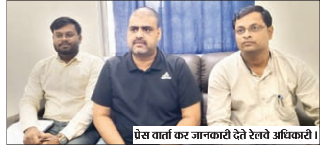
प्रेस वार्ता कर जानकारी देते रेलवे अधिकारी।

की गई अमृत भारत स्टेशन योजना के तहत देशभर के 1309 रेलवे स्टेशनों को अत्याधुनिक सुविधाओं के साथ पुनर्विकास किया जा रहा है। भारतीय विविधता की भव्यता को प्रदर्शित करते हुए, ये पुनर्विकसित स्टेशन नई अत्याधुनिक यात्री सुविधाओं के साथ-साथ मौजूदा सुविधाओं के उन्नयन और प्रतिस्थापन से सुसज्जित होंगे। अमृत भारत स्टेशन योजना के तहत नियोजित सुविधाओं में अवांछित संरचनाओं हटाकर रेलवे स्टेशन तक सुगम पहुंच,