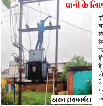
पानी के लिए होना पड़ रहा परेशान

ट्रांसफार्मर खराब होने के कारण बाजार सहित कई मोहल्ले में बिजली सप्लाई नहीं हो पा रही है। बिजली नहीं होने के कारण लोगों को सुबह से ही पानी के लिए हैंडपंप पर लाइन लगाना पड़ रहा है। निजी बोरिंग भी बिजली नहीं होने के कारण नहीं चल पा रही है। इसके अलावा बच्चों की पढ़ाई पूरी तरह प्रभावित हो गई है। लोगों का व्यवसाय भी ठप पड़ गया है।