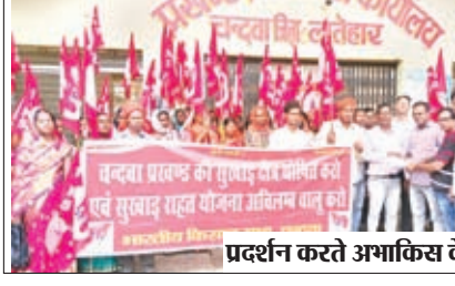
प्रदर्शन करते अभाकिस के लोग।