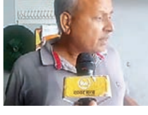
घटना की जानकारी देते दुकानदार।