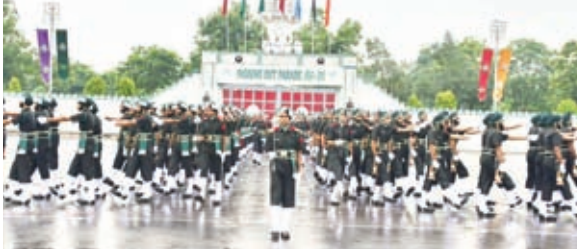
जवानों का शपथ ग्रहण समारोह किलाहारी ग्राउंड में आयोजित किया गया था।

पंजाब और सिख रेजीमेंटल सेंटर के प्रशिक्षित 687 अग्निवीरों ने देश सेवा की शपथ ली। पंजाब रेजिमेंटल सेंटर के 185 और सिख रेजीमेंटल सेंटर के 502 अग्निवीर