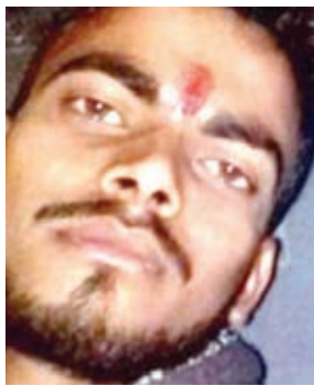
मृत युवक की फाइल फोटो।