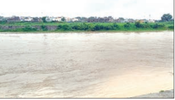
खरकाई नदी का बढ़ा जल स्तर।

की जान नहीं जाए। इतना ही नहीं शाम से ही तटीय इलाकों में लाउडस्पीकर के जरिए लोगों को नदी तट से दूर रहने के लिए अलर्ट किया जा रहा है। एसडीओ पिपूस