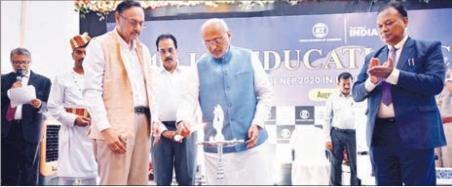
उद्घाटन करते राज्यपाल सीपी राधाकृष्णन।

रांची। राज्यपाल सीपी राधाकृष्णन ने कहा कि महान भारतीय अंतरिक्ष वैज्ञानिक डॉ के कस्तुरीरंगन की अध्यक्षता में गठित आयोग की अनुशंसा पर केंद्र सरकार द्वारा जनमानस के अनुरूप राष्ट्रीय शिक्षा नीति 2020 राष्ट्र के समक्ष प्रस्तुत की गयी। इस शिक्षा नीति को प्रस्तुत करने के पूर्व संपूर्ण देश के विभिन्न शिक्षाविदों व शोधार्थियों इत्यादि का सुझाव भी लिया गया था। राज्यपाल