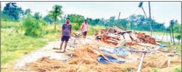
हाथियों ने उखाड़ दिया फार्म हाउस

सोनाहात। प्रखंड के हेसाडीह पंचायत के कई गांव इन दिनों जंगली हाथियों के निशाने पर है। ग्रामीणों के अनुसार 10 से 12 की संख्या में हाथियों का झुंड हेसाडीह जंगल में जमे हुये है। शाम होते ही सीधे गांव को ओर रुख करते है। जो घर सामने मिला इकट्टे धावा बोल कर क्षतिग्रस्त कर देते है। रात भर उत्पात के बाद सुबह खेत में सब्जी को नष्ट कर देते है। हाथियों के स्वभाव में बदलाव हुआ है, ये काफी