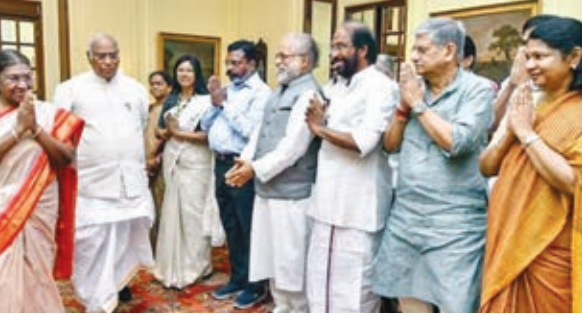
नयी दिल्ली में बुधवार को राष्ट्रपति से मिलते विपक्ष के सांसद।

हमने राष्ट्रपति को ज्ञापन सौपा है। वहां घटने वाली घटनाओं, खासकर महिलाओं के खिलाफ अत्याचार के बारे में उन्हें अवगत कराया। हम राष्ट्रपति का ध्यान आकर्षित करने के लिए मिले।