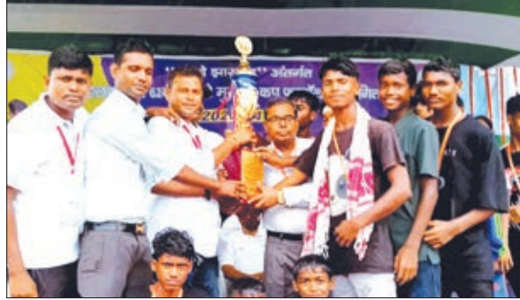
ट्रॉफी के साथ खिलाड़ी।

स्कूल गुमला ने 1-0 से जीत दर्ज करते हुए खिताब जीता। तीनों विजेता टीम 7 से 9 अगस्त तक रांची के खेल गांव में होने वाली राज्य स्तरीय 62वीं प्री-सुब्रतो मुख्यजी फुटबॉल प्रतियोगिता 2023-24 में दक्षिणी छोटानगपुर का प्रतिनिधित्व करेंगी।