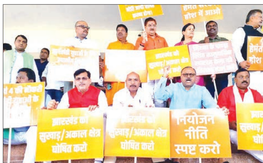
सदन के बाहर अपनी विभिन्न मांगों को लेकर नारेबाजी करते भाजपा विधायक।

करते रहे। वे सरकार हाथ-हाथ के नारे लगाते रहे। बजट पास होते ही हंगामे के कारण सदन की कार्यवाही बुधवार सुबह