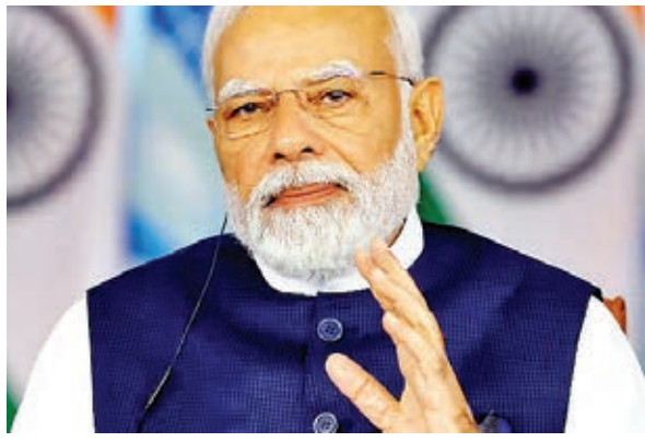
केंद्र सरकार की विभिन्न विकास पहलों को रेखांकित किया। बैठक में मौजूद कुछ सांसदों ने कहा कि मोदी ने समाज के हर वर्ग से जुड़ने

प्रधानमंत्री ने झारखंड, बंगाल और ओड़िशा के सांसदों को दी सलाह, कहा- तीन तलाक का मामला उठायें