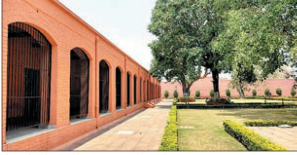
जेल मोड़ स्थित बिरसा मुंडा स्मृति पार्क का खूबसूरत नजारा।

राज्य सरकार की अदृष्टिर्शाती की आलोचना करते हुए कहा कि