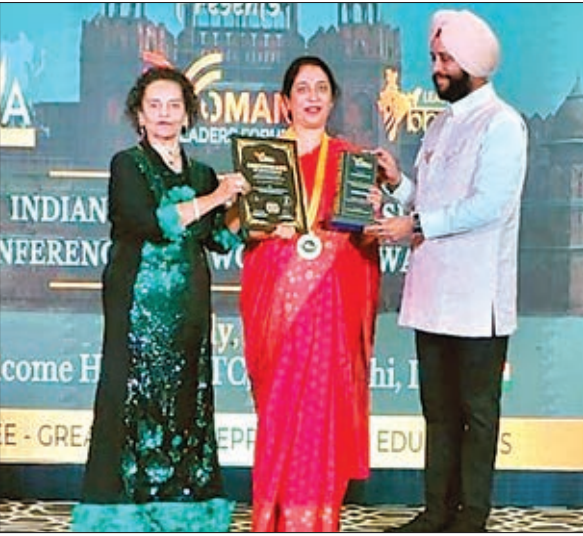
पुरस्कार ग्रहण करतीं सरला बिरला पब्लिक स्कूल की प्राचार्या ।