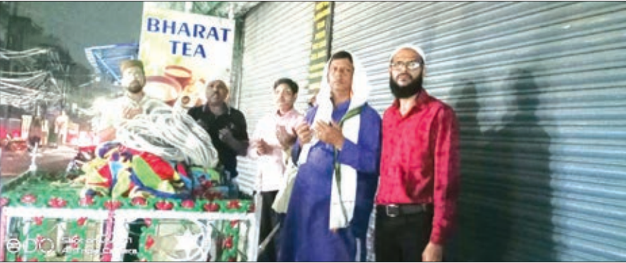
मुहर्रम का निशान उतारे जाने के मौके पर उपस्थित लोग ।

मौके पर राज्य एवं देश में अमन-शांति, उन्नति, एवं खुशहाली के साथ-साथ राज्य एवं मुल्क के सभी धर्मों के लोगों की तरक्की एवं आपसी सौहार्द के लिए