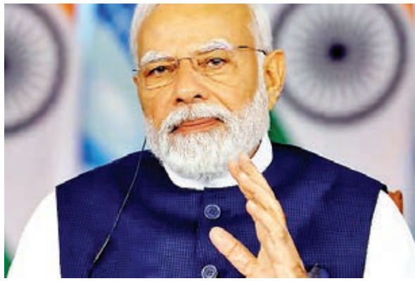
केंद्र सरकार की विभिन्न विकास पहलों को रेखांकित किया। बैठक में मौजूद कुछ सांसदों ने कहा कि मोदी ने समाज के हर वर्ग से जुड़ने

प्रधानमंत्री ने झारखंड, बंगाल और ओड़िशा के सांसदों को दी सलाह, कहा- तीन तलाक का मामला उठायें