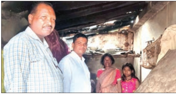
जानकारी लेते सीआइ व पूर्व मुखिया।