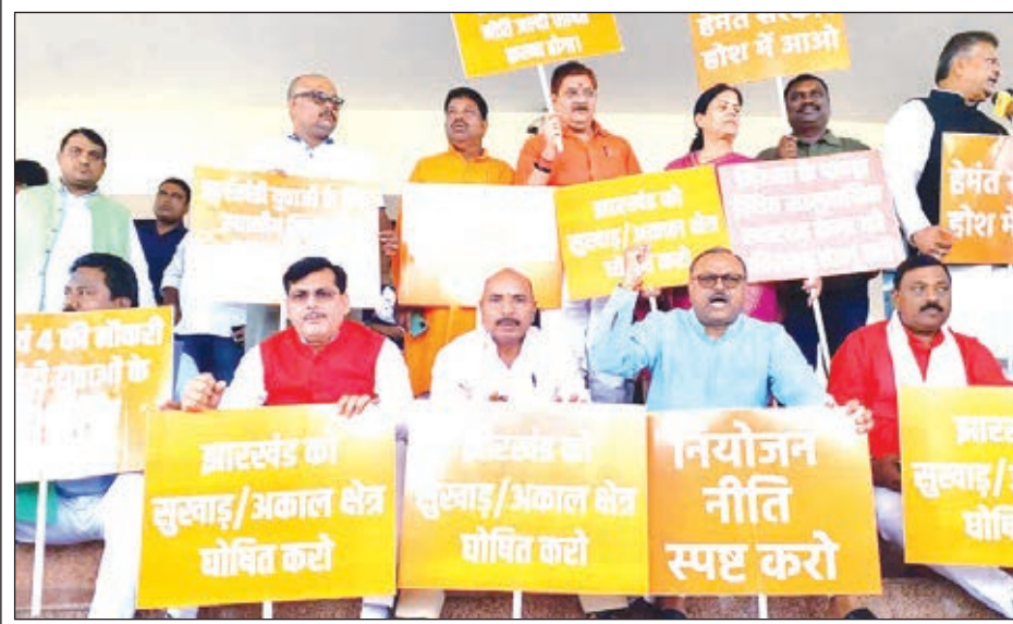
सदन के बाहर अपनी विभिन्न मांगों को लेकर नारेबाजी करते भाजपा विधायक।

करते रहे। वे सरकार हाथ-हाथ के नारे लगाते रहे। बजट पास होते ही हंगामे के कारण सदन की कार्यवाही बुधवार सुबह