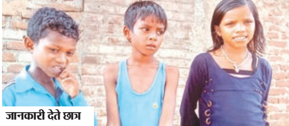
जानकारी देते छात्र