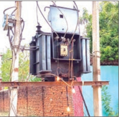
पीएचडी फीडर का ट्रांसफार्मर।

बरवाडीह। बरवाडीह प्रखण्ड मुख्यालय के मुख्य बाजार और आदर्श नगर पीएचडी फीडर से जुड़े सैकड़ों उपभोक्ता इन दिनों बिजली की लचर व्यवस्था से परेशान हैं। वहीं बिजली उपभोक्ताओं का कहना है कि विभाग के सहायक अभियंता दर्जनों बार फोन करने पर फोन तक नहीं रिसीव करते है और न ही मुख्यालय में ड्यूटी करते है। बिजली बिल की समस्या हो या लगातार विद्युत कटौती की। उपभोक्ताओं की लिप्ता भी समस्या का समय पर समाधान नहीं हो पा रहा है। विभाग की कार्यप्रणाली से नाराज उपभोक्ताओं का कहना है कि एसडीओ साहब