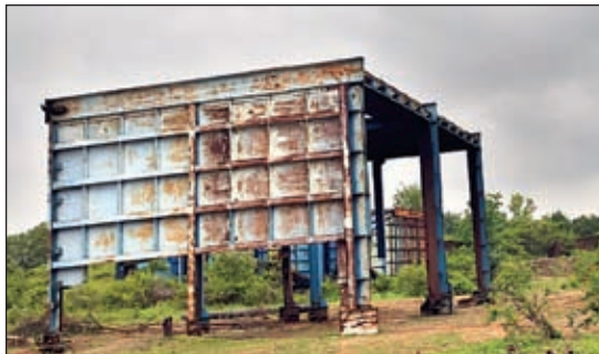
अभिजीत प्लांट का सीएचपी एरिया जहां से हो रही है चोरी।

चुसा था। वहां दीवार में लगे चैनल को वह खोल रहा था, एकाएक लोहे का चैनल व पूरी दीवार ही उसके उपर गिर गयी, जिससे वह गंभीर रूप से घायल हो गया। बाद में उसे कुछ लोगों के द्वारा उसे सामुदायिक स्वास्थ्य केंद्र चंदवा लाया गया, जहां से उसे रांची रेफर कर दिया गया था। रांची जाने के क्रम में ही उसकी मौत हो गई।