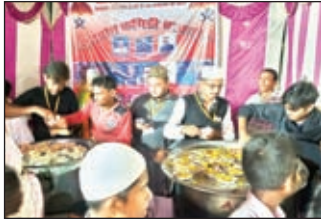
सिस्टर विहारण करते नौजवान कमेटी के सदस्य

बरवाडीह। हजरत इमाम हसन हुसैन की सच्चाई के प्रति बलिदान की याद में मुहर्रम पर्व क्षेत्र में शांति एवं सौहार्दपूर्ण माहौल में शनिवार को संपन्न हो गया। इस अवसर पर प्रखण्ड के विभिन्न क्षेत्रों से ताजिया