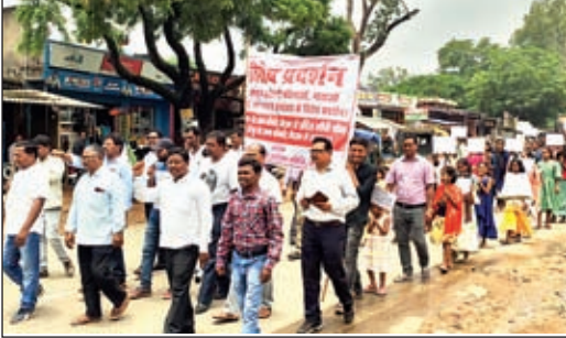
विरोध प्रदर्शन करते लोग।