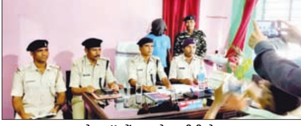
प्रेस कॉन्फ्रेंस करते एसडीपीओ।

उसके पास से एक मोबाइल बरामद किया गया है। गिरफ्तार नक्सली जिले के रमकंडा थाना क्षेत्र के गोरेयाकरम गांव निवासी बताया जाता है। रंका एसडीपीओ