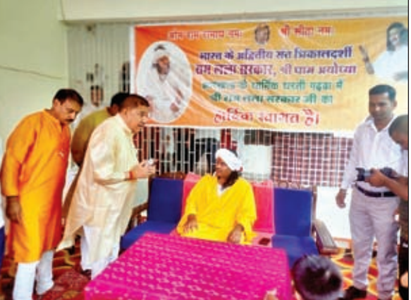
दरबार में आशीर्वाद लेते पूर्व मंत्री, पर्चा बनाते बाबा।