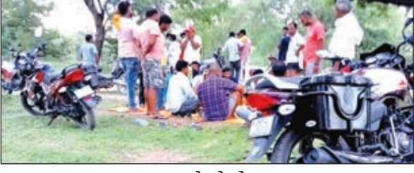
जुआ खेलते लोग

खबर मन्त्र संवाददाता भवनाथपुर। थाना क्षेत्र अंतर्गत कई ठिकानों पर रोजाना लाखों रुपये का जुआ का खेल चल रहा है। लेकिन प्रशासन इन पर कार्रवाई के बजाए अनभिज्ञ बनी हुई है। जानकारी के अनुसार थाना क्षेत्र के मुसकैनी पहाड़ी स्थित श्मशान घाट स्थित चौपाल में, अधौरा के नवही और चेपली पहाड़ी पर दोपहर के बाद जुआरियों की बिसात बिछ रही है। जिसमें स्थानीय जुआरियों के अलावे बाहर से 25-30 जुआरी जुआ खेलने पहुंचते हैं। जुआ अंड्रे पर नास्ता, ठंडा पानी और चाय की व्यवस्था के लिए अलग से आदमी