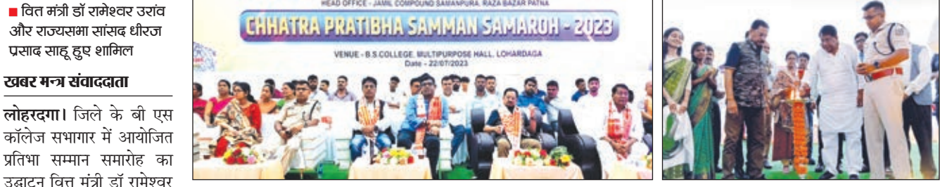
■ वित्त मंत्री डॉ रामेश्वर उरांव और राज्यसभा सांसद धीरज प्रसाद साहू हुए शामिल

कार्यक्रम के दौरान मंच पर उपस्थित और सम्मान समारोह का उद्घाटन करते अतिथि।