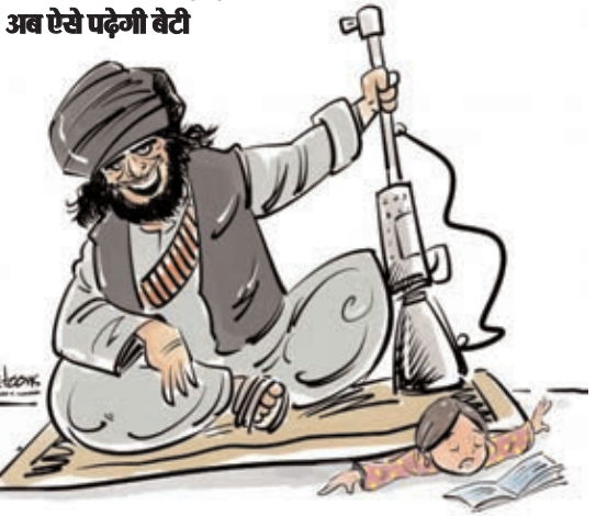
साधार कॉर्नम्यूवेंट डॉकूम