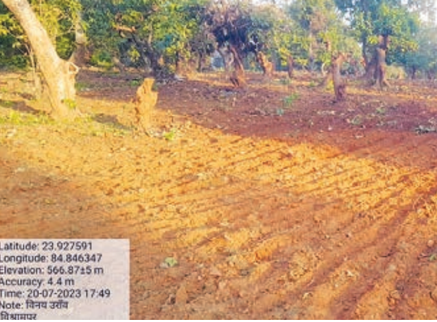
वहीं कई ग्रामीणों को समझाया गया और उन्हें चेतावनी दी गई कि भविष्य में इस तरह का वन अपराध ना करें