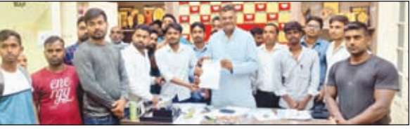
सदर विधायक व अन्य

झारखंड शारीरिक शिक्षण प्रशिक्षित शिक्षक संघ ने सदर विधायक को सौपा ज्ञापन