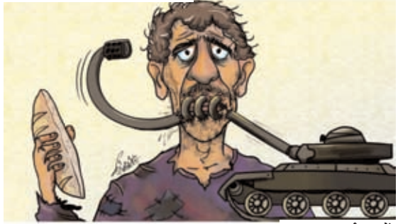
समाहर कार्टून मूवेंट