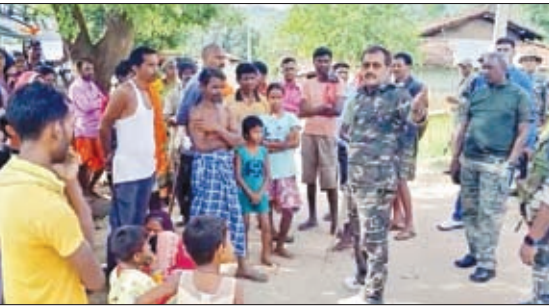
शुक्रवार को ग्रामीणों से मिलने पहुंचे आईजी और एसपी