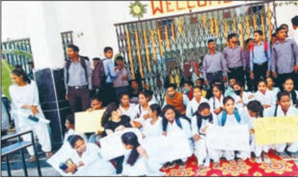
बहुदेशीय भवन के समक्ष धरना पर बैठे छात्र और कुलपति का घेराव कर वार्ता करते विद्यार्थी।