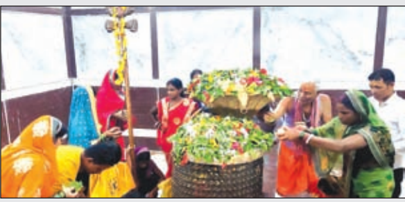
खबर मन्त्र संवाददाता

कांडी। पवित्र श्रावण मास की दूसरी सोमवार के अवसर पर प्रखण्ड क्षेत्र के सभी शिवालयों पर सुबह से ही भक्तों की भीड़ लगी रही। विदित हो कि इस वर्ष के श्रावण मास की बहुत ही खास महत्व है इस वर्ष श्रावण मास दो माह के होने के कारण भक्तों में अलग ही उत्साह है।