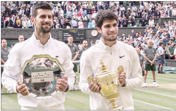
एक वक्त 6-6 की बराबरी पर पहुंच गया था। इसके बाद टाई-ब्रेकर खेला गया, जिसे

लंदन। स्पेन के कार्लोस अल्काराज ने इतिहास रच दिया है। वह विंबलडन 2023 के चैंपियन बन गए हैं। पांच सेट तक चले फाइनल में वर्ल्ड नंबर-वन अल्काराज ने वर्ल्ड नंबर-दो सर्विया के नोवाक जोकोविच को 6-1, 6-7(6), 1-6, 6-3, 6-4 से हरा दिया। इस जीत के साथ ही अल्काराज विंबलडन जीतने वाले स्पेन के सिर्फ तीसरे खिलाड़ी बने। 12 साल बाद स्पेन के किसी खिलाड़ी ने यह ग्रैंड स्लैम जीता है। यह अल्काराज का दूसरा ग्रैंड स्लैम है। इससे पहले वह 2022 में यूएस ओपन का खिताब जीत चुके हैं। पहले सेट जोकोविच ने 6-1 से जीत लिया। इसके बाद दूसरे सेट में अल्काराज ने जबरदस्त वापसी की। यह सेट