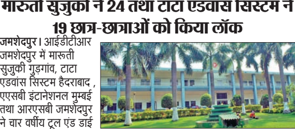
इंडो डेनिस टूल रूम का कैंपस।