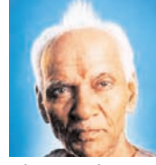
श्रीराम शर्मा आचार्य

उठो! जागो! रुकी मत!!! जब तक की लक्ष्य न प्राप्त न हो जाए। कोई दूसरा हमारे प्रति बुराई करे या निंदा करे, उद्देगजनक बात कहे तो उसको सहन करने और उसे उत्तर न देने से वैर आगे नहीं बढ़ता। अपने ही मन में कह लेना चाहिए कि इसका सबसे अच्छा उत्तर है मौन। जो अपने कर्तव्य कार्य में जुटा रहता है और दूसरों के अवगुणों की खोज में नहीं रहता उसे आंतरिक प्रसन्नता रहती है।