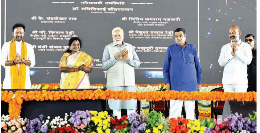
तेलंगाना में कई योजनाओं का शिलान्यास करते प्रधानमंत्री नरेंद्र मोदी। साथ में केंद्रीय मंत्री नितिन गडकरी।

मणिपुर में मीड ने दो वाहनों में लगाई आग इफाल। मणिपुर में जारी हिंसा के बीच शुक्रवार रात इफाल पश्चिम जिले में भीड़ ने दो वाहनों को आग लगा दी जबकि इफाल पूर्वी जिले में गोलीबारी की भी सूचना है। यह जानकारी प्रशासनिक अधिकारियों ने शनिवार को यहां दी। आधिकारिक सूत्रों ने बताया कि लोगों के एक समूह ने बीती रात ऐतिहासिक कांगला किले के पास महाबली रोड पर दो निजी वाहनों को जला दिया। उपद्रवियों को संदेह था कि उन चार पहिया वाहनों का इस्तेमाल एक विशेष जातीय समुदाय के लिए घरेलू सामान ले जाने के लिए किया जा रहा था। पुलिस के हस्तक्षेप के चलते भीड़ तितर-बितर हो गयी लेकिन दोनों वाहनों के चालक भाग निकले।