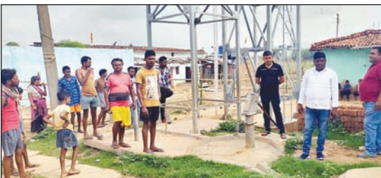
जानकारी देते ग्रामीण

चंदवा। हर घर तक स्वच्छ पेयजल मुहैया हो इस उद्देश्य से केंद्र सरकार के द्वारा जल जीवन मिशन कार्यक्रम के तहत संचालित महत्वकांक्षी हर घर जल नल योजना चंदवा में भ्रष्टाचार व अनियमितता की भेंट चढ़ती नजर