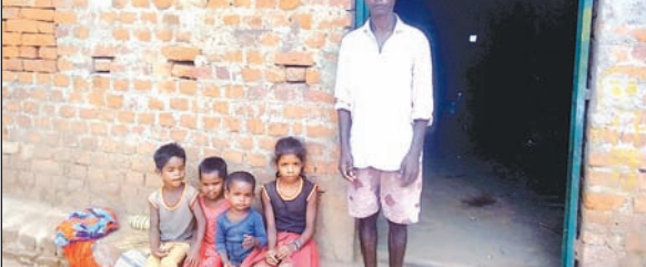
जानकारी देते पीड़ित