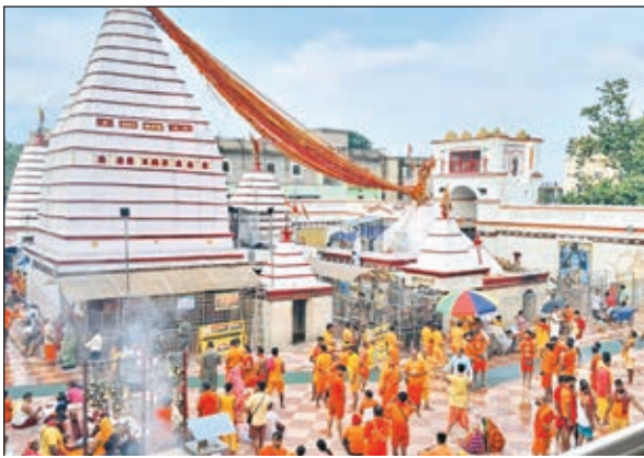
बासुकीनाथ धाम में जलाभिषेक के लिए पहुंचे श्रद्धालु।