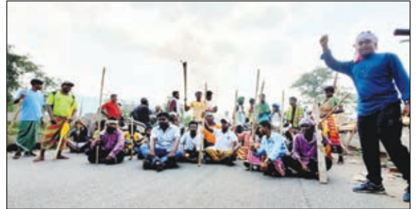
डिमना चौक पर एनएच-33 जाम करते बंद समर्थक।