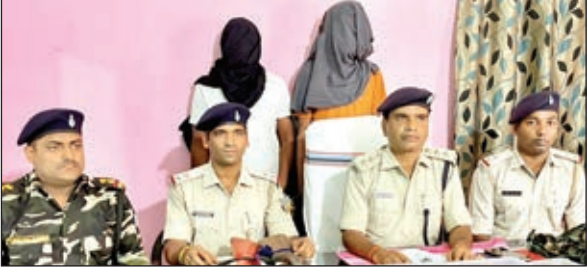
प्रेस कॉन्फ्रेंस करते एसडीपीओ