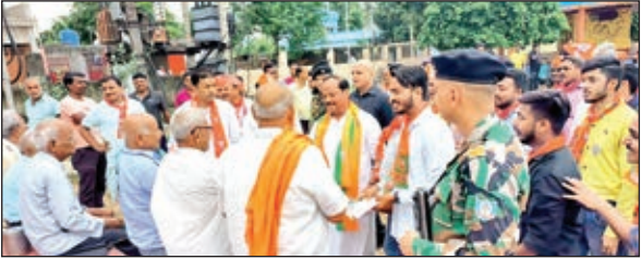
अपने सेवा क्षेत्र के बुजुर्गों से मिल कर खुशी व्यक्त करते पूर्व सीएम रघुवर दास।