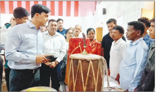
कार्यक्रम का उद्घाटन करते उपायुक्त व आदिवासी महिलाएं और मेले में लगाये गये स्टॉल का निरीक्षण करते उपायुक्त।