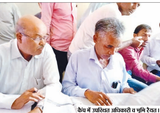
कैंप में उपस्थित अधिकारी व भूमि रैयत।