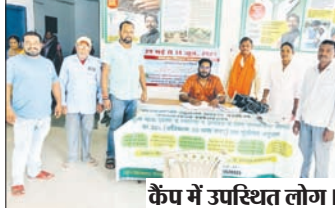
कैंप में उपस्थित लोग।