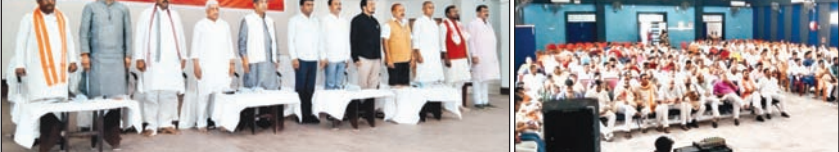
कार्यकर्ताओं को अथक प्रयास से महाजनसंपर्क अभियान सफल रहा : सांसद

द्वारा किया जाता है। इस पार्टी में किस कार्यकर्ताओं को कब व कहां कौन सा पद प्राप्त होगा यह उस कार्यकर्ता को भी पता नहीं चल पाता है। उन्होंने कार्यकर्ताओं के हौसला आफजाई करते हुए कहा कि आपसबों के कड़ी मेहनत व लगन के कारण महाजनसंपर्क अभियान चारों जिला में सफल हुआ है। जो आपसभी बधाई के पात्र हैं। पलामू सांसद विष्णुदयाल राम ने संबोधित करते हुए कहा कि पलामू संसदीय क्षेत्र में महाजनसंपर्क अभियान को जिस प्रकार से समर्पित कार्यकर्ता व मंडल अध्यक्षों ने सफल बनाया है इसका मैं हृदय से सभी को धन्यवाद ज्ञापित करते हैं। नरेंद्र मोदी के नेतृत्व में देश जिस उंचाईयों को छुआ है उसका नतमस्तक देश के विभिन्न देश हो चुके हैं। पाकी विधायक कुशवाहा डॉ शशिभूषण मेहता ने