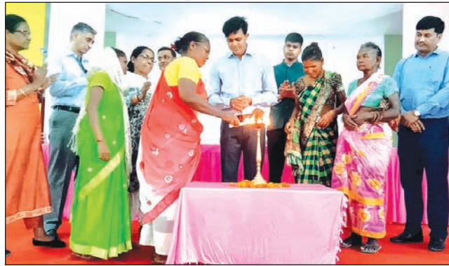
कार्यक्रम का उद्घाटन करते उपायुक्त व आदिवासी महिलाएं और मेले में लगाये गये स्टॉल का निरीक्षण करते उपायुक्त।