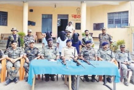
उग्रवादियों के साथ एसडीपीओ थाना प्रभारी व अन्य।