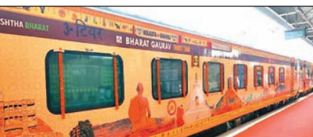
नवनिर्मित भारत गौरव ट्रेन की (फाइल फोटो)।

मुजरोकी इसलिए जमशेदपुर समेत कोल्हान के इच्छुक लोग इस यात्रा के लिए टिकट बुक करवा सकते हैं। इस यात्रा के लिए बिल्कुल नवनिर्मित 11 कोच वाली भारत गौरव ट्रेन में कुल 780 पर्यटकों के लिए सीट उपलब्ध है। सीट की बुकिंग पहले आओ,पहले पाओ की तर्ज पर करायी जा सकती है। पर्यटकों को सेवा देने के लिए