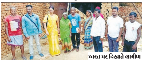
ध्वस्त घर दिखाते ग्रामीण।