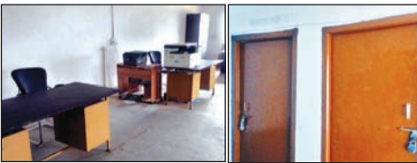
सुनसान अंचल व प्रखंड कार्यालय व बंद पाड़ा बैठा ।

उंटारी रोड : बीडीओ, सीओ समेत प्रखंड सह अंचल कर्मी रहे अनुपस्थित