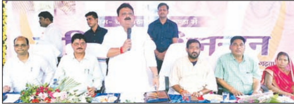
कार्यक्रम को संबोधित करते मंत्री।

जल संरक्षण की 2500 योजनाओं की हुई शुरुआत, 650 एकड़ भूमि पर होगा पौधरोपण, परिसंपत्ति का किया वितरण