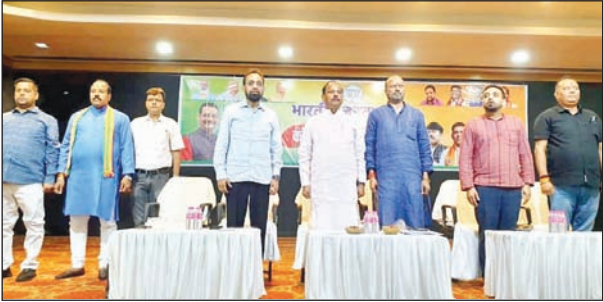
तुलसी भवन में प्रमंडल स्तरीय बैठक में उपस्थित भाजपा के राष्ट्रीय उपाध्यक्ष रघुवर दास, सांसद व अन्य वरिष्ठ पदाधिकारीगण।

जमशेदपुर। आगामी लोकसभा चुनाव के मद्देनजर भारतीय जनता पार्टी ने अपनी तैयारियां तेज कर दी हैं। शनिवार को भाजपा को ओर से झारखंड के पांचों प्रमंडल में प्रमंडल स्तरीय बैठक सम्पन्न आयोजित की गई। इसी क्रम में, जमशेदपुर में भाजपा की कोल्हान प्रमंडलीय बैठक बिस्वपुर स्थित तुलसी भवन के मुख्य सभागार में सम्पन्न हुई। बैठक के दौरान प्रधानमंत्री नरेंद्र मोदी के नेतृत्व में केंद्र सरकार के नौ साल पूरे होने पर पिछले एक महीने से चल रहे