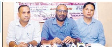
माता वैष्णो देवी उत्तर भारत टूर की जानकारी देते आइआरसीटीसी के अधिकारीगण।

आइआरसीटीसी ने 11 अगस्त को रवाना होने वाली ट्रेन के शिड्यूल जारी किया आइआरसीटीसी के वेबसाइट अथवा टाटानगर रेलवे स्टेशन से बुक करवायें सीट