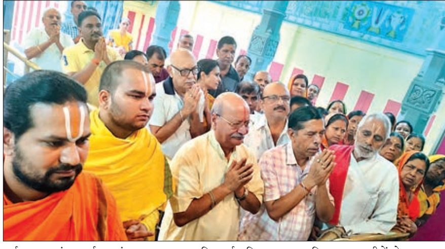
पूर्वक छत्र, चंवर, दर्पण, व्यंजन, पादुका आदि समर्पण किया गया। फिर सत्ताइस दीपों से युक्त नखत्र

रांची। श्रीलक्ष्मी वेंकटेश्वर मंदिर में गुरुवार को श्रीहरिशयनी एकादशी व्रत अनुष्ठान किया गया। भगवान श्रीमन्नारायण का प्रातः काल ब्रह्म मुहूर्त में सुप्रभात, मंगला शासनम, वेंकटेश स्तोत्र एवं षोडशोपचार पूर्वक दैनिक पूजा करके दूध, दही, मधु, घो लावा आदि से नहलाया गया। फिर उत्तम चंदन का लेप करके धूप दिखाकर मनोहर पुष्प और तुलसी दल से पंचोपचार सेवा हुई। श्रीभगवान दंपति को दंत धावन, आचमनीय, पुनराचमनीय के पश्चात उपचार