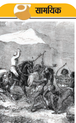
इसके बाद सिद्धो और कान्हो को

माटी छोड़ो, अबुवा दिशुम, अबुवा राज के नारों के साथ अंग्रेजों के खिलाफ युद्ध करने का एलान किया। संथाल विद्रोहियों के आक्रामक रवैये से घबराकर अंग्रेजो ने उनका दमन प्रारंभ करना शुरू कर दिया। जब अंग्रेजो का दमन बढ़ने लगा तो इसकी प्रतिक्रिया में आदिवासियों ने अंग्रेजी सरकार की ओर से आये जमींदारों और सिपाहियों को मौत के घाट उतार दिया। तब विद्रोहियों को सबक सिखाने के लिए अंग्रेजों ने फूरता की सारी हदें पार कर दीं। चांद और भैरव को अंग्रेजों ने मार डाला। एक अंग्रेज इतिहासकार हंटर ने अपनी पुस्तक में लिखा है कि इस महान क्रांति में लगभग 20000 से अधिक आदिवासियों को अंग्रेजो ने गोलियों की तड़तड़इहट से मौत के घाट उतार दिया।