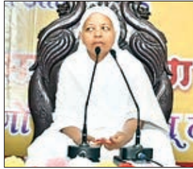
विभाश्री माताजी (फाइल फोटो)

माताजी ने कहा कि बच्चों को सब कुछ स्कूल में नहीं सिखाया जाता है, सब कुछ किताबों से नहीं सिखाया जाता है, बच्चा जो अपनी