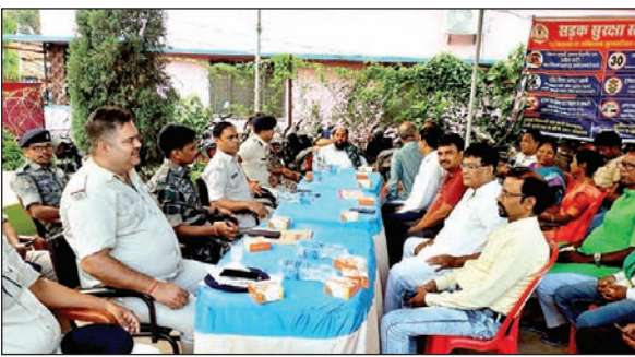
बैठक करते पुलिस पदाधिकारी एवं सदस्य।