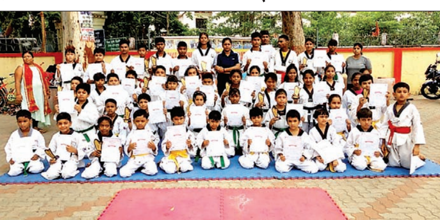
ग्रेडिंग पाने वाले बच्चे एवं प्रशिक्षक।