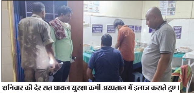
शनिवार की देर रात घायल सुरक्षा कर्मी अस्पताल में इलाज कराते हुए।

लातेहार/चंदवा। चंदवा के बाना चकला स्थित बंद पड़े अभिजीत प्लांट में इन दिनों स्कूप माफिया व चोरों का आतंक सर चढ़ कर बोल रहा है। स्कूप माफियाओं और चोरों का दुस्साहस इतना बढ़ गया है कि शनिवार की देर रात्रि प्लांट की सुरक्षा को लेकर तैनात सैप जवान व एसआईएस सिक्वोरिटी