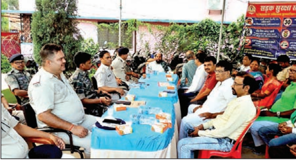
बैठक करते पुलिस पदाधिकारी एवं सदस्य।