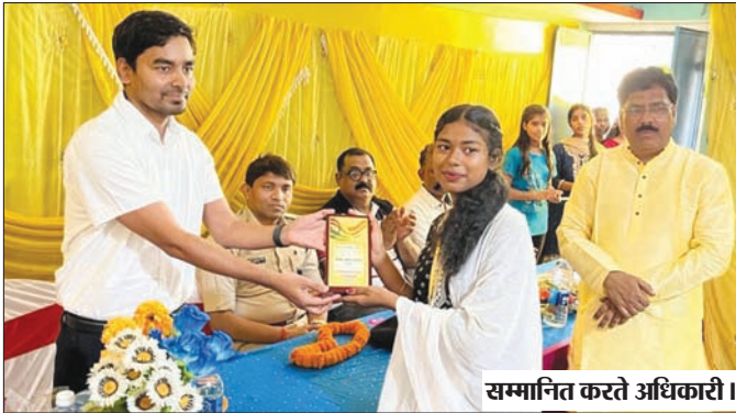
सम्मानित करते अधिकारी।