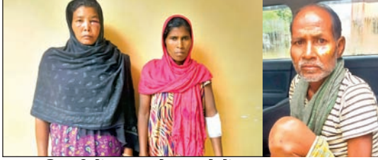
डायन बिसाही में हुए जानलेवा हमले में घायल ।