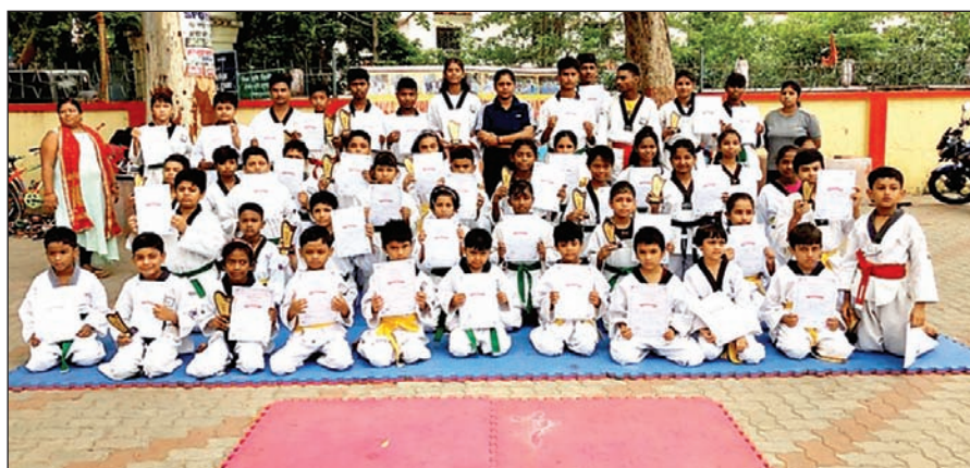
ग्रेडिंग पाने वाले बच्चे एवं प्रशिक्षक।