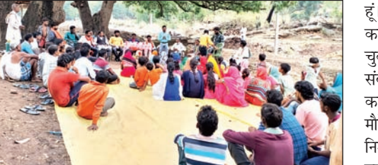
जनसुनवाई में उपस्थित ग्रामीण ।

कुड़ु। स्थानीय विधायक सह मंत्री डॉ रामेश्वर उरांव ने कुड़ु प्रखंड के सुंदरू पंचायत में आयोजित जनसुनवाई कार्यक्रम में ग्रामीणों की समस्या से रूबरू हुए और स्थानीय लोगों से मुलाकात कर उनका कुशलक्षेम कि जानकारी ली। जनसुनवाई कार्यक्रम में ग्रामीणों ने आवेदन के माध्यम से सड़क निर्माण, पेय जल आपूर्ति, बिजली आपूर्ति, विधवा पेंशन, अंचल कार्यालय संबंधी, आवास योजना से संबंधित समस्याएं