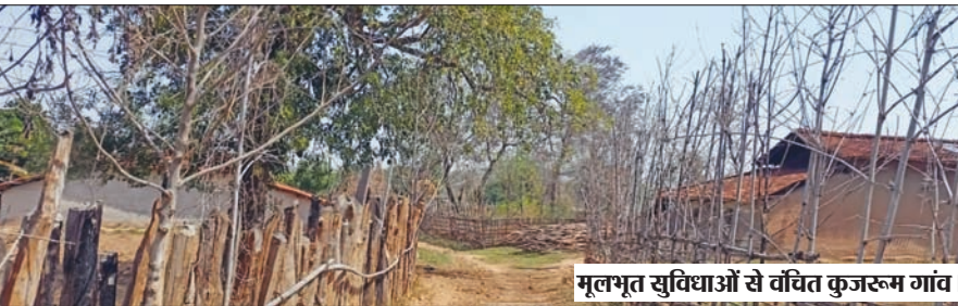
मूलभूत सुविधाओं से वंचित कुजरूम गांव।