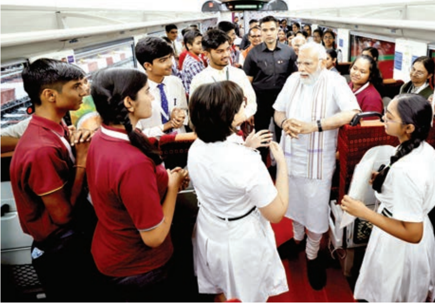
वंदे भारत एक्सप्रेस में छात्रों से बातचीत करते प्रधानमंत्री नरेंद्र मोदी।

चुकी है। अगर तीन तलाक इस्लाम का जरूरी अंग है, तो पाकिस्तान, इंडोनेशिया, कतर, जॉर्डन, सीरिया, बांग्लादेश में क्यों नहीं है। मुस्लिम बेटियों पर तीन तलाक का फंदा लटकाकर कुछ लोग उन पर हमेशा अत्याचार करने की खुली छूट चाहते हैं। इसीलिए मेरी मुस्लिम बहनें, बेटियां भाजपा और मोदी के साथ खड़ी हैं। उन्होंने कहा कि वोट बैंक की राजनीति करने वाले नेताओं ने कभी मुसलमानों के हित की बात नहीं की। अगर वे उनके सच्चे हितैषी होते तो अधिकांश परिवारों में शिक्षा, रोजगार होता और उनका जीवन सुगम होता। भोपाल में आयोजित मेरा बूथ, सबसे मजबूत कार्यक्रम को