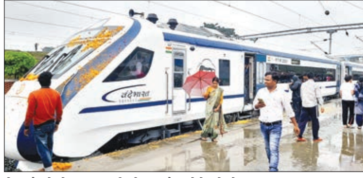
मेसरा रेलवे स्टेशन पर पहुंची वंदे भारत ट्रेन को देखते लोग।

ओरमांडी। झारखंड से बिहार के लिए चली पहली वंदे भारत एक्सप्रेस ट्रेन का मेसरा रेलवे स्टेशन पर जोरदार स्वागत किया गया। रांची रेलवे स्टेशन से चली ट्रेन 11.20 बजे जैसे ही मेसरा रेलवे स्टेशन पहुंची, स्वागत के लिए खड़े लोगों ने फूलवर्षा कर जोरदार स्वागत किया। वहीं हर्षित लोग भारत माता की जय का घोष करने लगे। इस स्वर्णिम पल को यादगार बनाने के लिए लोग अपनी-अपनी मोबाइल से सेल्फी ले रहे थे। वंदे भारत ट्रेन का मेसरा स्टेशन में स्वागत करने के लिए विभाग द्वारा विशेष तैयारी की गई थी। रेलवे स्टेशन पर कलाकार रंगीन वस्त्र पहने ढोल बजा रहे थे। इससे पूर्व स्टेशन पर झारखंड के कलाकरों द्वारा नृत्य किया गया। वंदे भारत ट्रेन मेसरा स्टेशन प्लेटफार्म संख्या एक पर पहुंची। सबसे पहले राज्यपाल सीपी राधाकृष्णन उतरे, स्वागत में खड़े रेलवे अधिकारियों द्वारा राज्यपाल का स्वागत किया गया। वहीं वंदे भारत एक्सप्रेस ट्रेन के स्वागत