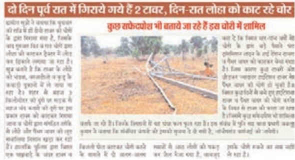
दो दिन पूर्व रात में गिराये गये है 2 टावर, दिन-रात लोहा को काट रहे चोर

बता दें कि पिगत शनिवार को हिंदी दैनिक खबर मंत्र ने चोरों द्वारा ट्रांसमिशन लाइन के दो हाईटेंशन टावर को काटकर गिराए जाने व बेखौफ होकर चोरी किए जाने के मामले को प्राथमिकता से उठाया था व प्रशासन को पूरे मामले से अवगत भी कराया था। प्रशासन के द्वारा कहा गया था कि उनके पास गिराए गए टावर को रखने का जगह नहीं है, उन्होंने संबंधित कंपनी को इसकी जानकारी दे दी है। टावर का चोरी रूक गया लेकिन मामला टंडा पड़ते ही महज दो