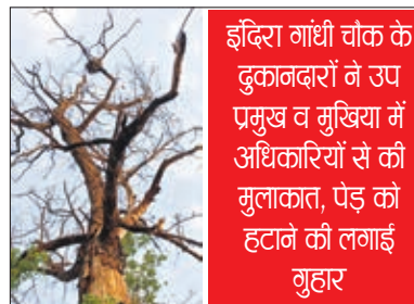
इंदिरा गांधी चौक के दुकानदारों ने उप प्रमुख व मुखिया में अधिकारियों से की मुलाकात, पेड़ को हटाने की लगाई गुहार