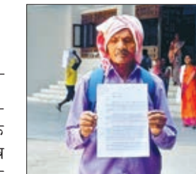
आवेदन देने जाता ग्रामीण।

वन क्षेत्र में मशीन द्वारा कार्य से रोजगार एवं आजीविका का हुआ संकट