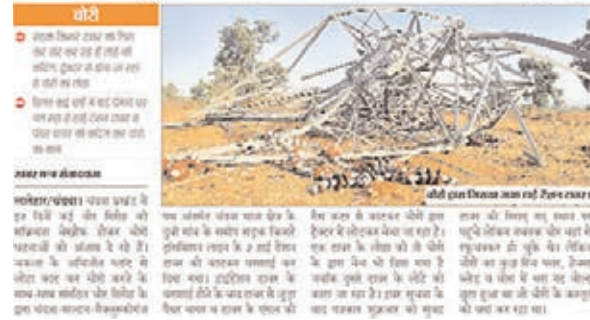
दो दिन पूर्व रात में गिराये गये है 2 टावर, दिन-रात लोहा को काट रहे चोर