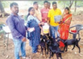
लाभुकों को बकरा-बकरी वितरण करते अतिथि।