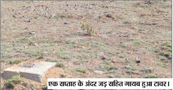
एक सप्ताह के अंदर जड़ सहित गायब हुआ टावर।

धीरे-धीरे करके चोरी कर लिया गया लममग 60 से 70 टन टावर का लोहा व पंथर वायर