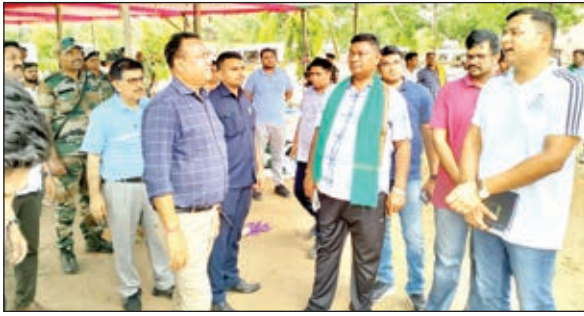
खबर मन्त्र संवाददाता

सिमरिया। प्रखंड के इचाक खुर्द में झारखंड के आधी आबादी गैरमजरूआ जमीन पर निवास करने के साथ अपने परिवार का जीविकोपार्जन कर रहे है। ऐसे में गैरमजरूआ जमीन का रैयती मान्यता नहीं दे कर झारखंडियो को धोखा दिया जा रहा है। अपनी मांग को शांतिपूर्ण प्रदर्शन के निर्णय लेने पर प्रशासन द्वारा इसे कुचलने का कुचक्र रचा रहा जा रहा है। आंदोलनकारियों को जगह जगह पर दबाने की कोशिश की जा रही है। हम आंदोलन को दबने नहीं देंगे और रेलवे विभाग के मंसूबे को सफल नहीं होने देंगे।