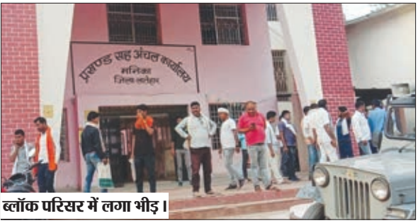
ल्लोक परिसर में लगा भीड़।