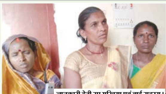
जानकारी देती उप मुखिया एवं वार्ड सदस्य।