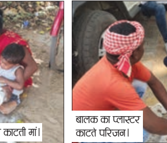
बालक का प्लास्टर काटते परिजन।