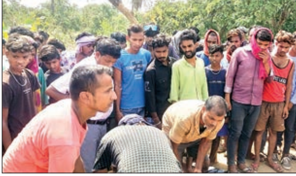
शव को कब्जे में लेती पुलिस