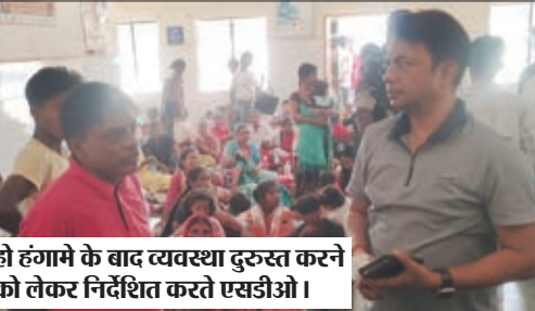
हो हंगामे के बाद व्यवस्था दुकुरस्त करने को लेकर निर्देशित करते एसडीओ।

चंदवा। चंदवा स्थित सामुदायिक स्वास्थ्य केंद्र में रविवार को सरकारी व्यवस्था की पोल खुल कर रह गई। बीते दिनों इंपैक्ट इंडिया फाउंडेशन के द्वारा चंदवा टोरी जंक्शन व चंदवा सीएचसी में लगाए गए निःशुल्क स्वास्थ्य जांच शिविर में मुड़े हुए हाथ पैर का ऑपरेशन व सर्जरी कराने वाले मरीजों के परिजनों