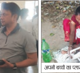
अर्जनी बत्ती का प्लास्टर काटती मा।

को रविवार को स्वयं ही मरीजों के पट्टी व प्लास्टर काटना पड़ा। मरीज के परिजन खुद ही ब्लेड, कांच के टुकड़े व हाथों से ही प्लास्टर हटाते नजर आए। परिजन अपने अपने मरीजों को लेकर लातेहार जिले के गारु, महूआडांड, बरवाडीह, बालूमाथ, हेरहंज, बरियातु, पलामु, चतरा, सिमडेगा समेत दूसरे प्रदेश के लोग भी पहुंचे थे। उनसे पूछे जाने पर उन्होंने बताया कि इंपैक्ट इंडिया के