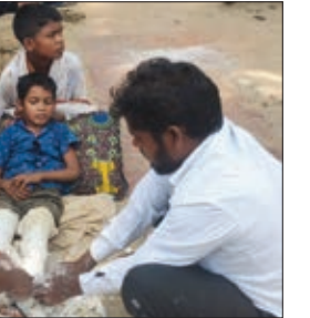
बालक का प्लास्टर काटते परिजन।

लोग का जरिया बना हुआ है पूरा प्रखंड कार्यालय ही बिचौलियों के इशारे में चल रहा है। पहले भी टीसीबी योजना में भारी अनियमितता का मामला प्रकाश में आया था जिस पर सल्लिप कर्मियों के ऊपर कार्रवाई करते हुए जिला प्रशासन ने योजनाओं को रद्द करने का आदेश