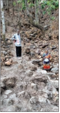
चुआं से पानी लेकर जाती महिला।

हिंडालको कंपनी के सह पर जवाडीह क्षेत्र में अवैध माइनिंग कर माइंस संचालक मालामाल हो रहे हैं और क्षेत्र के ग्रामीण अपने बदहाली पर आंसू बहा रहे हैं। अवैध माइनिंग के कारण सरकार को तो करोड़ों रुपये राजस्व की हानि हो रही है। वहीं ग्रामीणों को अवैध माइनिंग से मौत तक मिल रहे हैं। अवैध उखनन के कारण लोग उसे उखने वाले धूलकण के कारण टीबी जैसे घातक बीमारी का भी शिकार हो रहे हैं। जबकि देश को यक्षमा मुक्त करने का अभियान चलाया जा रहा है। क्षेत्र के ग्रामीणों की हालत तो यह है कि वह अपनी पीड़ा या दुःखड़ा किसको सुनायें। क्योंकि हिंडालको कंपनी को उनकी समस्याओं से कोई लेना देना नहीं है। खनन विभाग वहां जाती नहीं है और प्रशासन केवल बंटवारे में ही हिंदाश देकर अपने दायित्व को इतिश्री कर लेता है। यही कारण है कि विशुनपुर प्रखंड के पाठ व माइंस क्षेत्रों के लोग आज भी बुनियादी सुविधा के लिए तरसते नजर आते हैं। कभी उनका दरबार लगती भी है तो ग्रामीण सीना चिरकर अपना दर्द अधिकारी के समक्ष झापन साँपकर रखते हैं लेकिन जनता दरबार के बाद शायद उनके झापनों पर कोई पहल होती भी है या नहीं ग्रामीण आज तक समझ नहीं पायें हैं। हालात तो यह हैं कि क्षेत्र के लोग भगवान मरसे ही अपने जीवन की नैया किस्ती तरह खँवकर पार लगाने में जुट हैं।