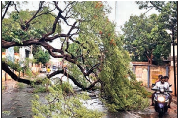
सड़क पर गिरा विशालकाय पेड़

तेज हवा से कई विशालकाय पेड़ गिरे, यातायात बाधित