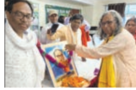
डॉ. भीमराव अंबेडकर के चित्र पर माल्यार्पण करते अतिथि।