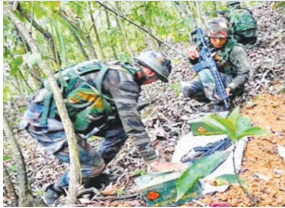
संवेदनशील इलाकों में तलाशी अभियान के दौरान सुरक्षा बल के जवान।

मणिपुर में करीब एक महीने पहले भड़की जातीय हिंसा में कम से कम 100 लोगों की मौत हुई है और 310 अन्य घायल हुए हैं। राज्य में शांति बहाल करने के लिए सेना और अर्धसैनिक बलों के जवानों को तैनात किया गया है। गौरतलब है कि मणिपुर में अनुसूचित जनजाति