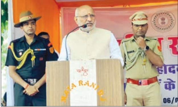
संबोधित करते राज्यपाल