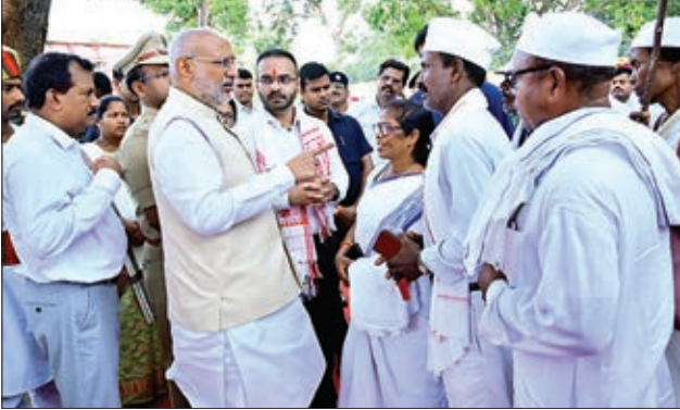
टाना भगत से मिलते राज्यपाल

लोहरदगा। राज्यपाल ने कहा कि लोहरदगा जिला में बेहतर कार्य हो रहा है। ग्रामीण क्षेत्र में महिलाएं महिला स्वयं सहायता समूह से जुड़कर बेहतर कर रही है और आय का सृजन कर रही हैं। जब गांव विकास होंगे तो निश्चित रूप से हम सभी का विकास होगा। हम सभी के पंथ व समुदाय है बेशक अलग है लेकिन आपसी संघर्ष से बेहतर है कि सभी मिलजुल कर कार्य करें और गांव में खुशहाली लाए। उक्त बातें महामहिम राज्यपाल ने आज मंगलवार को लोहरदगा जिला के सदर मंगलवार में ग्राम भक्सो ग्राम में आयोजित ग्रामीणों के संवाद कार्यक्रम में कही। कार्यक्रम से पूर्व राधाकृष्णन को गाई ऑफ ऑनर भी दिया गया। राज्यपाल ने कहा कि तमिलनाडु के त्रिसुर से आज लोहरदगा जिला में आने से अपार खुशी मिल रही है। ग्रामीण क्षेत्र में लोगों के रहन-सहन में काफी सुधार हुआ है। लोहरदगा जिला उन जिलों में अग्रणी है जहां लाभकों