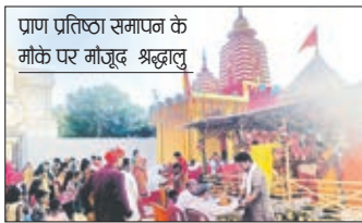
प्राण प्रतिष्ठा समाजण के मौके पर मौजूद श्रद्धालु