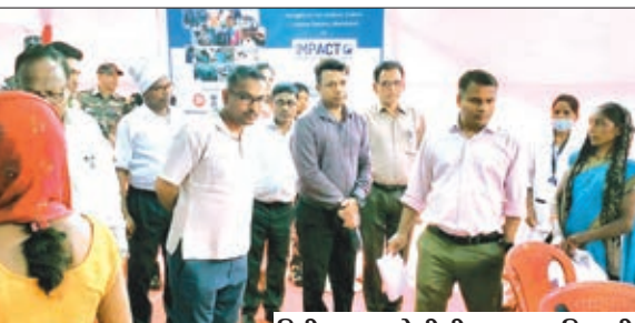
निरीक्षण करते डीसी व अन्य अधिकारी।

चंदवा। इंपैक्ट इंडिया फाउंडेशन एवं जिला प्रशासन के सौजन्य से लाइफलाइन एक्सप्रेस हॉस्पिटल ट्रेन के 231 वें प्रोजेक्ट के तहत चंदवा के टोरी स्टेशन में आयोजित निःशुल्क स्वास्थ्य शिविर का आज उपायुक्त श्री भोर सिंह यादव द्वारा निरीक्षण कर वस्तुस्थिति का जायजा लिया गया। इस दौरान उपायुक्त द्वारा निबंधन काउंटर का निरीक्षण कर मरीजों के निबंधन, आवासन, भोजन, पेयजल, स्वच्छता, सुरक्षा सहित संबंधित अन्य व्यवस्थाओं का अवलोकन कर वस्तुस्थिति से अवगत हुए। इस दौरान उन्होंने सामुदायिक स्वास्थ्य केंद्र चंदवा के परिसर में लगाये गये स्वास्थ्य जाँच शिविर में मरीजों के स्वास्थ्य जाँच कार्य का जायजा लिए। इसके पश्चात उन्होंने ऑपरेशन/सर्जरी के उपरांत चिकित्सीय देखभाल में रखे गये