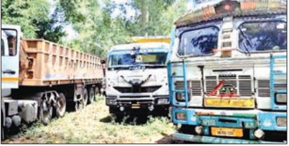
जांच करते अधिकारी एवं जप्त वाहन