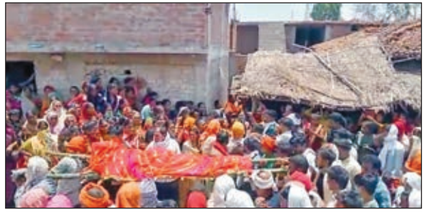
शव को ले जाते लोग