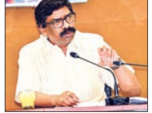
...और क्या बोले सीएम हेमंत

सभी पदाधिकारी योजनाओं का आकलन करें : मुख्यमंत्री श्री सोरेन ने विभागीय सचिवों को कहा