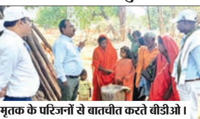
मृतक के परिजनों से बातचीत करते बीडीओ।

मृतक की पत्नी को पेंशन और अंबेडकर आवास का दिया लाभ बीडीओ ने पीड़ित परिवार को दी आर्थिक मदद व पचास किलो चावल