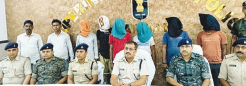
प्रेस वार्ता कर जानकारी देते एस्पि व अन्य।