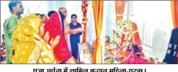
पूजा अर्चना में शामिल श्रद्धालु महिला-पुरुष।