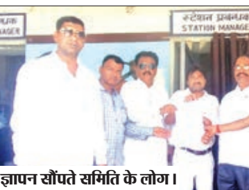
ज्ञापन सौंपते समिति के लोग।

चंदवा। झारखंड विकास समिति की ओर से रेल मंत्री भारत सरकार, महाप्रबंधक (जी.एम) एवं पूर्व मध्य रेल हाजीपुर डी.आर.एम धनबाद के नाम आवेदन नियर रेलवे स्टेशन के प्रबंधक को दिया गया। जिसमें कहा गया कि बी.डी.एम सवारी गाड़ी को कई बार बात बात में बंद कर दिया जाता है। इस सवारी गाड़ी के बंद होने से आम लोगों को काफी परेशानी का सामना