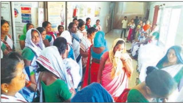
मृत सहिया के शव के समीप रती बिलखती दूसरी सहिया साथी और सहियाओं से बातचीत करते थाना प्रभारी।