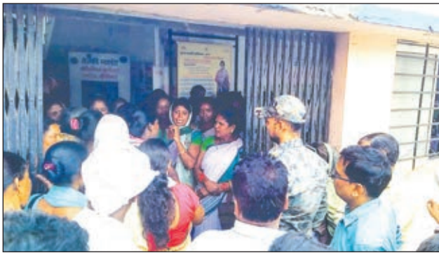
मृत सहिया के शव के समीप रती बिलखती दूसरी सहिया साथी और सहियाओं से बातचीत करते थाना प्रभारी।