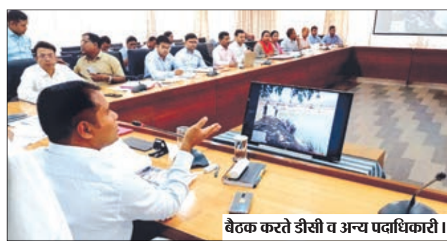
बैठक करते डीसी व अन्य पदाधिकारी।

योजना के तहत जिला में 75 तालाबों का अमृत सरोवर योजना के तहत जीर्णोद्धार/ निर्माण कार्यों का क्रियान्वयन किया जा रहा है। ताकि भूमिगत जलस्तर बढ़ाया जा सके। उपायुक्त ने कहा कि लातेहार जिला में लक्ष्य के विरुद्ध जल्द से जल्द सभी विभागों के अधिकारी अपने अपने विभागों के तालाबों के जीर्णोद्धार के अमृत सरोवर केंद्र सरकार की मदद से सभी अधिकारियों