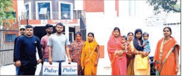
भुरकुंडा ओपी में न्याय की गुहार लगाते लोग।