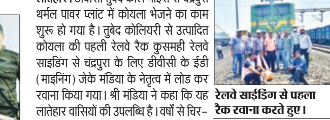
रेलवे सार्डिङिंग से पहला रैक रवाना करते हुए।