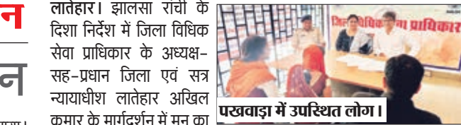
पखवाड़ा में उपस्थित लोग।

लातेहार। झालसा रांची के दिशा निर्देश में जिला विधिक सेवा प्राधिकार के अध्यक्ष-सह-प्रधान जिला एवं सत्र न्यायाधीश लातेहार अखिल कुमार के मार्गदर्शन में मन का मिलन पखवाड़ा का आयोजन जिला विधिक सेवा प्राधिकार के तत्वावधान में 29 मई से शुभारंभ किया गया। ज्ञात हो कि 29 मई से 14 जून तक सिविल कोर्ट परिसर में मन का मिलन पखवाड़ा का आयोजन किया जा रहा है। मौके पर कुटुंब न्यायालय लातेहार से रेफरल मामले का भी निष्पादन किया गया। इस मामले में पति पत्नि के बीच में मध्यस्थता कराया गए दोनों को राजी खुशी से एक दूसरे साथ रहने के लिए सलाह दी गई। दोनों इस बात पर राजी भी हुए और खुशी से अपने घर गए। मन के मिलन पखवाड़ा का मुख्य उद्देश्य मध्यस्था के प्रति सामान्य जनमानस को जागरूक करना है। जिला विधिक सेवा प्राधिकार की सचिव ने जानकारी दी कि मन का मिलन पखवाड़ा का आयोजन का मुख्य उद्देश्य मध्यस्थता है। मन का मिलन पखवाड़ा के तहत पक्षकारों के मध्य सुलह-समझौता का आयोजन किया जाएगा। जिसमें मध्यस्थतकर्ता के साथ पुलिस पदाधिकारी भी मौजूद रहेंगे। मध्यस्थता के प्रति सामान्य जनमानस को जागरूक करना इस आयोजन का मुल मंत्र है।