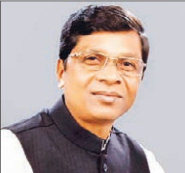
सुदर्शन भगत, सांसद लोहरदगा।

जुड़ी है। आज कितने बच्चों और पूर्ववर्ती छात्राओं के विशेष स्थापित कर नामकरण करने चाहिए थे परंतु यह किये