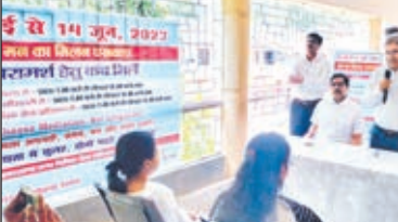
कार्यक्रम को संबोधित करते प्रधान जिला एवं सत्र न्यायाधीश।

गुमला। जिला विधिक सेवा प्राधिकार के द्वारा व्यवहार न्यायालय परिसर गुमला में आयोजित मन का मिलन पखवाड़ा मध्यस्थता कार्यक्रम का शुभारंभ सोमवार को किया गया। प्रधान जिला एवं सत्र न्यायाधीश सह अध्यक्ष जिला विधिक सेवा प्राधिकार गुमला के द्वारा दीप प्रज्वलित कर कार्यक्रम का शुभारंभ किया गया। 29 मई से 14 जून तक पखवाड़ा कार्यक्रम चलेगा। जिसमें डालसा द्वारा गटित