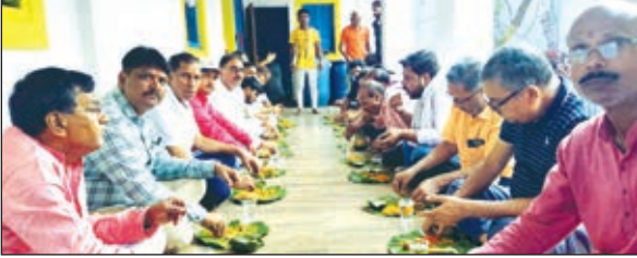
भंडारा में प्रसाद गहण करते श्रद्धालु।