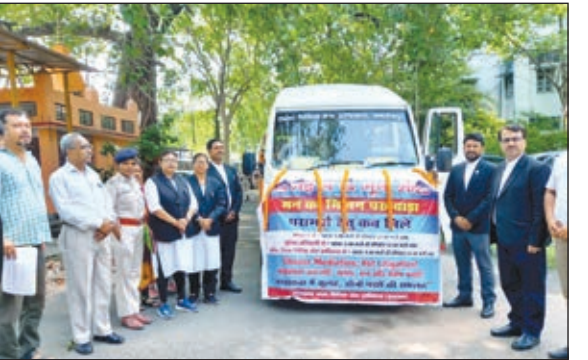
मिलन पखवाड़ा रथ रवाना करते प्रधान जिला न्यायाधीश।