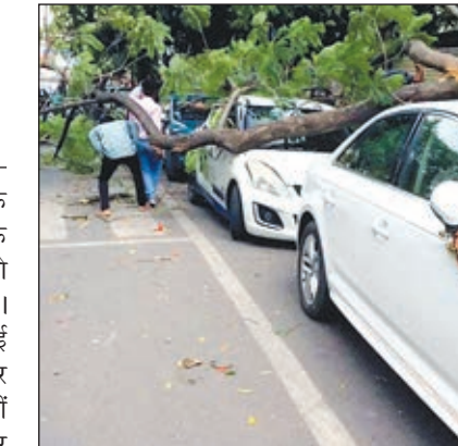
इसमें मुख्य रूप से राज्य के उत्तर पूर्वी और मध्य जिलों में बारिश के आसार हैं, जहां ओलावृष्टि भी होगी। इस क्षेत्र में देवघर, धनबाद, दुमका, गिरिडीह, पाकुड़, गोड्डा, जामताड़ा, बोकारो, रामगढ़, हजारीबाग, खूँटी आदि जिला शामिल हैं, जहां ओलावृष्टि की जानकारी दी गयी है। वहीं, अन्य