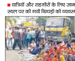
यात्रियों और राहगीरों के लिए जाम स्थल पर की गयी खिचड़ी की व्यवस्था

गुमला। पिछड़ा वर्ग संघर्ष समिति ने शुकवार को ओबीसी आरक्षण शून्य करने के विरोध में घाघरा बंद का व्यापक असर रहा। इस दौरान अहले सुबह से ही सैकड़ों की संख्या में ओबीसी वर्ग के महिला व पुरुष चांदनी चौक पहुंच चक्का जाम कर दिये। जिसके बाद वाहनों की लंबी कतार लग गयी। रांची छत्तीसगढ़ नेतरहाट मार्ग पूरी तरह जाम कर दिया गया और नारेबाजी की गयी। हेमंत सरकार हौश में आओ, ओबीसी को आरक्षण देना होगा, पिछड़ा वर्ग संघर्ष समिति जिंदाबाद के नारे लगाये गये। इस दौरान संघर्ष समिति के