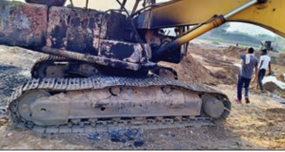
है कि माओवादियों का मकसद लेवी वसूलना है। मजदूरों ने बताया कि चेहरे ढंके आधुनिक हथियारों से लैस माओवादी पहुंचे और जनरेटर बंद कर दिया। सभी मजदूरों के मोबाइल छीन लिये। थोड़ी देर होने

महुआडांड। सरनाडीह चटकपुर मार्ग पर पीएम ग्राम सड़क योजना से करीब 3.60 करोड़ की लागत से हो रही पुलिया निर्माण स्थल पर माओवादियों ने जमकर उत्पात मचाया। गुस्वार देर रात करीब 14 हथियारबंद माओवादी आ धमके। एक पोकलेन समेत चार ट्रैक्टरों को आग के हवाले कर दिया। पुलिया निर्माण में लगे मजदूरों ने भारी दहशत में रात काटी। उनके साथ मारपीट भी की। पुलिस का कहना