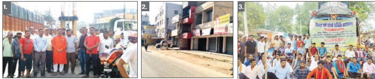
1. गुमला शहर के टावर चौक में सड़क जाम किये पिछड़ा वर्ग संघर्ष समिति के सदस्य। 2. पिछड़ा वर्ग संघर्ष समिति के आह्वान पर गुमला मेन रोड की बंद पड़ी दुकानें और 3. रायडीह में सड़क जाम कर बैठे लोग।

■ पिछड़ा वर्ग संघर्ष समिति के आह्वान पर गुमला जिला में आर्थिक नाकेबंदी रहा सफल, बंद के दौरान थम गई जिंदगी की रफ्तार ■ वाहनों का परिचालन रहा पूरी तरह ठप, स्वतः ही दुकानदारों ने अपनी प्रतिष्ठानों बंद रख पिछड़ी जाति के लोगों का किया समर्थन ■ रोस्टर पणाली में आरक्षण देने व बिहार के तर्ज पर पिछड़ों को राज्य में 27 प्रतिशत आरक्षण देने की मांग