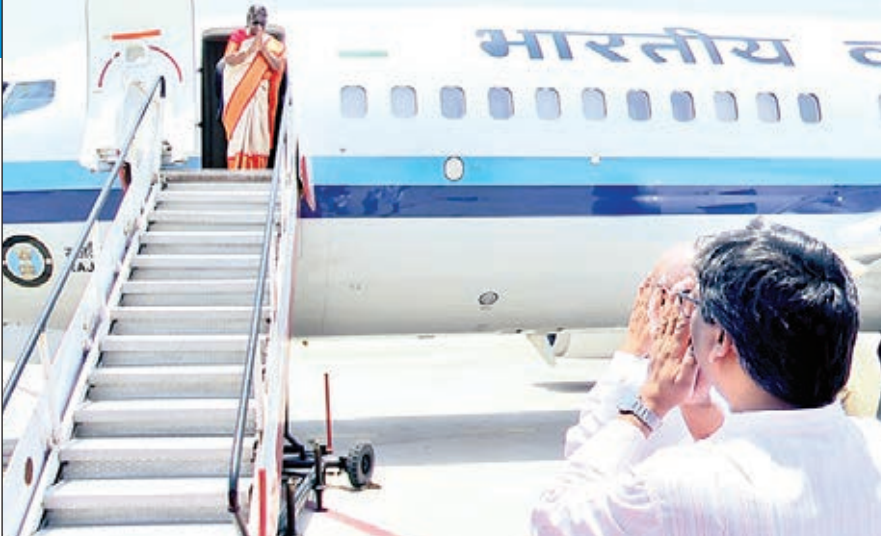
माननीय राष्ट्रपति परम आदरणीय द्रौपदी मुर्मू जी। झारखंड की आपकी इस यात्रा से संपूर्ण राज्यवासियों में ऊर्जा का संचार

हाथ हिला कर सबको जेहार करती रवाना हुई राष्ट्रपति: महामहिम हाथ हिलाकर सभी को जेहार बोलते हुए दिल्ली के लिए रवाना हो गयीं। मुख्यमंत्री हेमंत सोरेन ने द्रौपदी मुर्मू को यात्रा के संबंध में ट्वीट करते हुए लिखा, धन्यवाद, आभार और जेहार