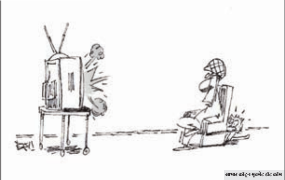
अनाकारों की विह्वलनीयता...