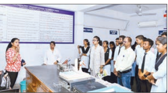
एनएमएल लैब देखते छात्र-छात्राएं।

लाल बहादुर शास्त्री मेमोरियल कॉलेज के छात्रों ने किया एनएमएल का परिभ्रमण