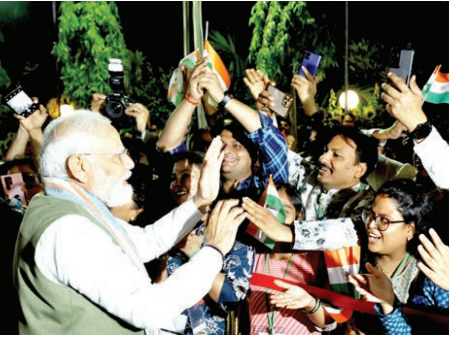
पापुआ न्यू गिनी एयरपोर्ट पर प्रधानमंत्री नरेन्द्र मोदी के स्वागत के लिए उमड़ी भीड़।

हिरोशिमा। प्रधानमंत्री नरेन्द्र मोदी ने रूस यूक्रेन के बीच टकराव को समाप्त करने के लिए विश्व के सर्वाधिक समृद्ध एवं शक्तिशाली सात देशों को भगवान बुद्ध के संदेश पर चलने का आह्वान किया जिसके अनुसार, शत्रुता से शत्रुता शांत नहीं होती। अपनत्व से शत्रुता शांत होती है। श्री मोदी ने जी-7 शिखर सम्मेलन के दूसरे दिन नौवें सत्र में अपने आरंभिक वक्तव्य में यह आह्वान किया। नौवें सत्र में वैश्विक शांति, स्थिरता एवं समृद्धि के विषय पर चर्चा में रूस यूक्रेन का विषय छाया रहा। श्री मोदी ने रूस यूक्रेन संघर्ष को टालने में संयुक्त राष्ट्र एवं सुरक्षा परिषद की विफलता का हवाला देते हुए वैश्विक निकायों में सुधार की मांग को पुरजोर तरीके से रखा। इस मौके पर अमेरिका के राष्ट्रपति जोसेफ आर बिडेन, ब्रिटेन के प्रधानमंत्री ऋषि सुनक, फ्रांस के राष्ट्रपति एमैनुएल मैक्रॉन, जर्मनी के चंसलर ओलोफ शोल्ज, जापान के प्रधानमंत्री फूमियो किशिदा और ऑस्ट्रेलिया के प्रधानमंत्री एंथनी अल्बनीज भी मौजूद थे। यूक्रेन के राष्ट्रपति वोल्दोमिर जेलेन्स्की के बयान का हवाला देते हुए श्री मोदी ने कहा कि आज हमने राष्ट्रपति जेलेन्स्की को सुना। कल मेरी उनसे मुलाकात भी हुई थी। मैं वर्तमान परिस्थिति को राजनीति या