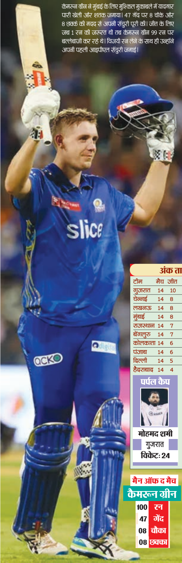
कैमरून वीन ने मुंबई के लिए मुश्किल मुकाबले में यादगार पारी खेली और शतक जमाया। 47 रन पर 8 चौके और 8 छक्के को मदद से अपनी सेंचुरी पूरी की। जीत के लिए जब 1 रन की जरूरत थी तब कैमरून वीन 99 रन पर बल्लेबाजी कर रहे थे। विजयी रन लेने के साथ ही उन्होंने अपनी पहली आइपीएल सेंचुरी जमाई।