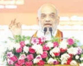
शाह ने कहा कि प्रधानमंत्री नरेन्द्र मोदी ने गुजरात के गांव-गांव में घूमकर और युवाओं को प्रेरित करके एक संगठन बनाकर परिवर्तन की ऐतिहासिक संरचना गुजरात में की। उन्होंने कहा कि

» गृह मंत्री ने मोदी समाज के राष्ट्रीय महासम्मेलन का किया उद्घाटन, कहा -टुकड़ों में बिखरे समाज को एकत्रित करने का हो रहा है प्रयास