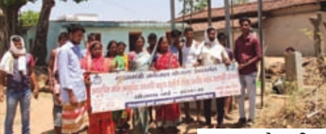
गुहुर लगाते ग्रामीण।