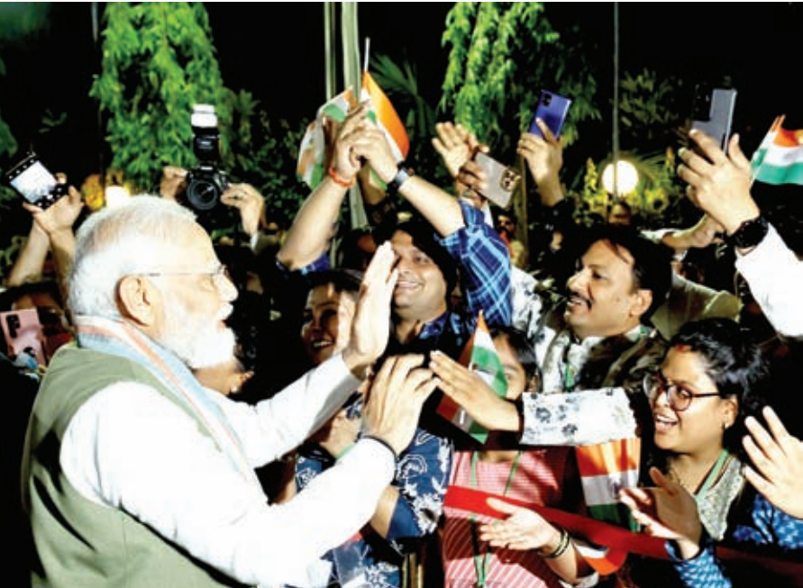
पापुआ न्यू गिनी एयरपोर्ट पर प्रधानमंत्री नरेंद्र मोदी के स्वागत के लिए उमड़ी भीड़।

हिरोशिमा। प्रधानमंत्री नरेन्द्र मोदी ने रूस यूक्रेन के बीच टकराव को समाप्त करने के लिए विश्व के सर्वाधिक समृद्ध एवं शक्तिशाली सात देशों को भगवान बुद्ध के संदेश पर चलने का आह्वान किया जिसके अनुसार, शत्रुता से शत्रुता शांत नहीं होती। अपनत्व से शत्रुता शांत होती है। श्री मोदी ने जी-7 शिखर सम्मेलन के दूसरे दिन नौवें सत्र में अपने आरंभिक वक्तव्य में यह आह्वान किया। नौवें सत्र में वैश्विक शांति, स्थिरता एवं समृद्धि के विषय पर चर्चा में रूस यूक्रेन का विषय छाया रहा। श्री मोदी ने रूस यूक्रेन संघर्ष को टालने में संयुक्त राष्ट्र एवं सुरक्षा परिषद की विफलता का हवाला देते हुए वैश्विक निकायों में सुधार की मांग को पुनरावृत्ति के साथ रखा। इस मौके पर अमेरिका के राष्ट्रपति जोसेफ आर बिडेन, ब्रिटेन के प्रधानमंत्री ऋषि सुनक, फ्रांस के राष्ट्रपति एमैनुएल मैक्रॉन, जर्मनी के चांसलर ओलोफ शोल्ट्ज, जापान के प्रधानमंत्री फूमियो किशिदा और ऑस्ट्रेलिया के प्रधानमंत्री एंथनी अल्बनीज़ भी मौजूद थे। यूक्रेन के राष्ट्रपति वोल्दोमिर जेलेन्स्की के बयान का हवाला देते हुए श्री मोदी ने कहा कि आज हमने राष्ट्रपति जेलेन्स्की को सुना। कल मेरी उनसे मुलाकात भी हुई थी। मैं वर्तमान परिस्थिति को राजनीति या