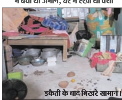
डकैती के बाद बिखरे सामान।