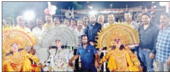
नृत्य दल का हौसला बढ़ाते सांसद विद्युत व अन्य अतिथि।