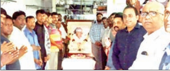
संस्थापक को नमन करते श्रीलेदर्स साकची के सदस्यगण।