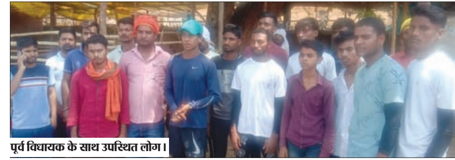
पूर्व विधायक के साथ उपस्थित लोग।

हेमंत सरकार जो वादा किए थे उस पर सरकार कार्य नहीं कर पा रही है जब तक यहां के स्थानीय युवक सरकारी कुर्सी पर नहीं बैठेंगे तब तक इस झारखंड का विकास संभव नहीं है। क्योंकि झारखंड का ऑरिजिनल झारखंडी वही है जिसके पास खतियान है इन्हीं सब मुद्दों के हेमंत सोरेन की सरकार बनी थी लेकिन सरकार बनते ही इन सब मुद्दों पर कोई कार्य नहीं हो रही है यहां तक स्थानीय युवा बेरोजगार हैं इस पर सरकार किसी प्रकार का कोई योजना नहीं बना रही है चुनाव के समय