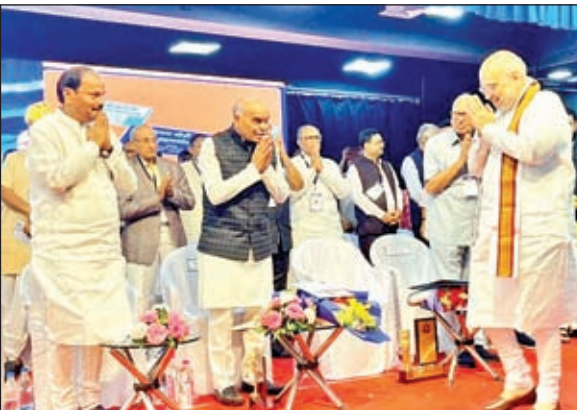
मंच पर गृह मंत्री अमित शाह का अभिवादन करते पूर्व सीएम रघुवर दास।