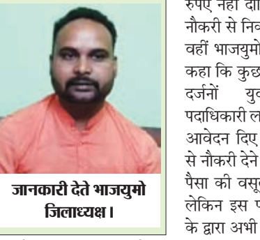
जानकारी देते भाजयुमो जिलाध्यक्ष।