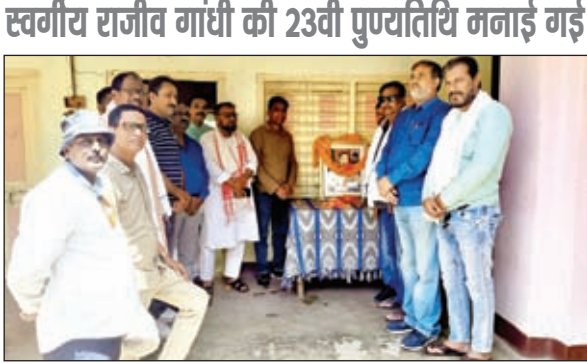
पुण्यतिथि मनाते कांग्रेसी

का प्रयास किए। साथ ही 18 वर्ष के युवाओं को उन्होंने पहली बार मताधिकार का अधिकार दिया। अपने कार्यकाल में उन्होंने देश में बहुत सारी योजना, परियोजनाओं को साकार किया आज उन्हीं की