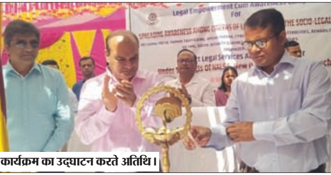
कार्यक्रम का उद्घाटन करते अतिथि।