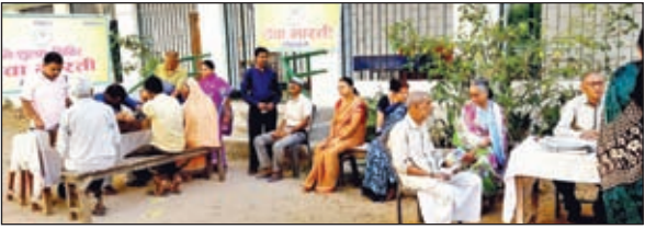
फोटो कैप्शन: 6 शिविर मौजूद लोग