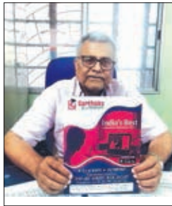
किंतु दुख का विषय है कि अब

सार्थक इंस्टीट्यूट कोटा (राजस्थान) के द्वारा आगामी 8 जून को कराया जाएगा डेमो क्लास