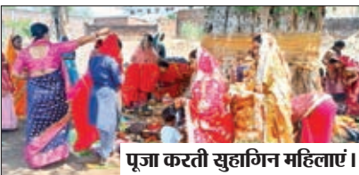
पूजा करती सुहागिन महिलाएं।