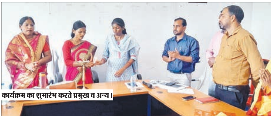
कार्यक्रम का शुभारंभ करते प्रमुख व अन्य।