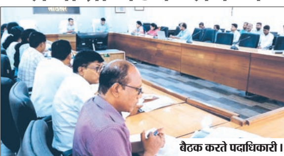
बैठक करते पदाधिकारी।

उपायुक्त की अध्यक्षता में समीक्षा बैठक संपन्न