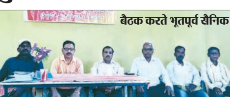
बैठक करते भूतपूर्व सैनिक।