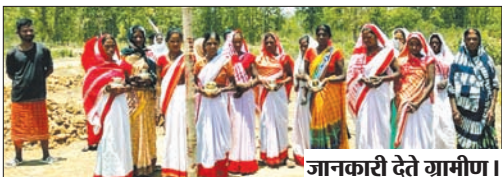
जानकारी देते ग्रामीण।

चंदवा। चंदवा प्रखण्ड के बोदा पंचायत अंतर्गत लुकुईया गांव में एनएच किनारे करीब 70 डिसमिल जमीन पर कुछ लोगों के द्वारा कब्जा करने का प्रयास किया जा रहा है। उक्त आरोप आसपास के रहने वाले आदिवासी लोग लगा रहे हैं। ग्रामीणों का कहना है कि खता 125 प्लॉट 98 में करीब 70 डिसमिल का जमीन है। जहां पर हमारे पूर्वजों के द्वारा पूजा अर्चना की जाती रही है। कई बार इस जमीन में विवाद भी हुआ है। 2005 से इसमें विवाद है लेकिन कब्जा करने वालों ने दबंगई दिखाते हुए जमीन में ट्रेच खोद डाला। गुरुवार को पूजा अर्चना करने