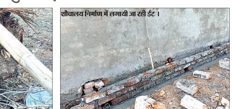
शौचालय निर्माण में लगायी जा रही ईंट।

बरवाडीह। संत मरियम उच्च विद्यालय छिपादोहर में एनआरडीपी लातेहार के सौजन्य से शौचालय का निर्माण कराया जा रहा है। जिसमें पुराने भवन से निकाले गए ईंट का प्रयोग किया जा रहा है। कार्य कर रहे मिस्त्री से पूछे जाने पर उन्होंने बताया कि विद्यालय के फादर के कहने पर पुराने ईंट को लगाया जा रहा है। इसके