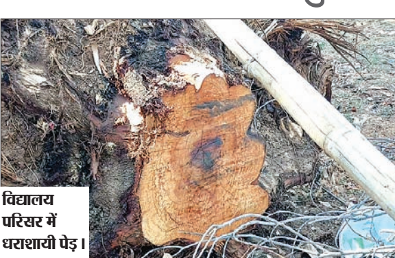
विद्यालय परिसर में धराशायी पेड़।

शौचालय निर्माण में पुरानी ईंट का किया जा रहा है प्रयोग