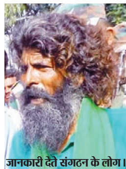
जानकारी देते संगठन के लोग।