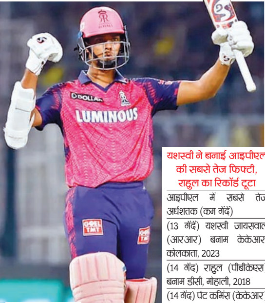
यशस्वी ने बनाई आइपीएल की सबसे तेज फिफ्टी, राहुल का रिकॉर्ड टूटा

आइपीएल में सबसे तेज अर्धशतक (कम गेंद) (13 गेंदें) यशस्वी जायसवाल (आरआर) बनाम केकेआर, कोलकाता, 2023 (14 गेंदें) राहुल (पीबीकेएस) बनाम डीसी, मोहाली, 2018 (14 गेंदें) पीट कर्मिस (केकेआर) बनाम एमआई, पुणे, 2022