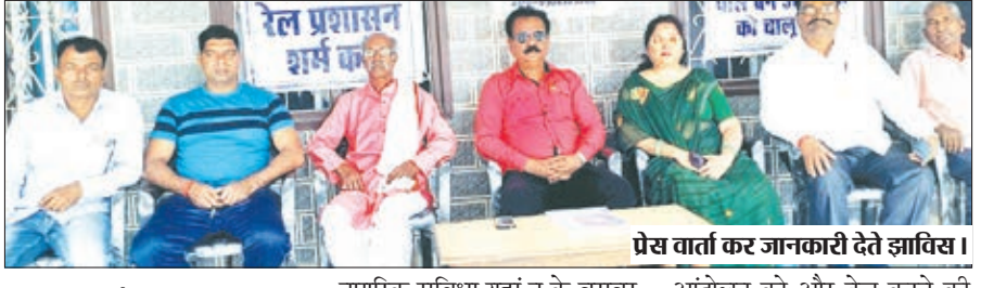
प्रेस वार्ता कर जानकारी देते झाविस ।