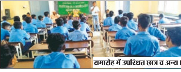
समारोह में उपस्थित छात्र व अन्य ।