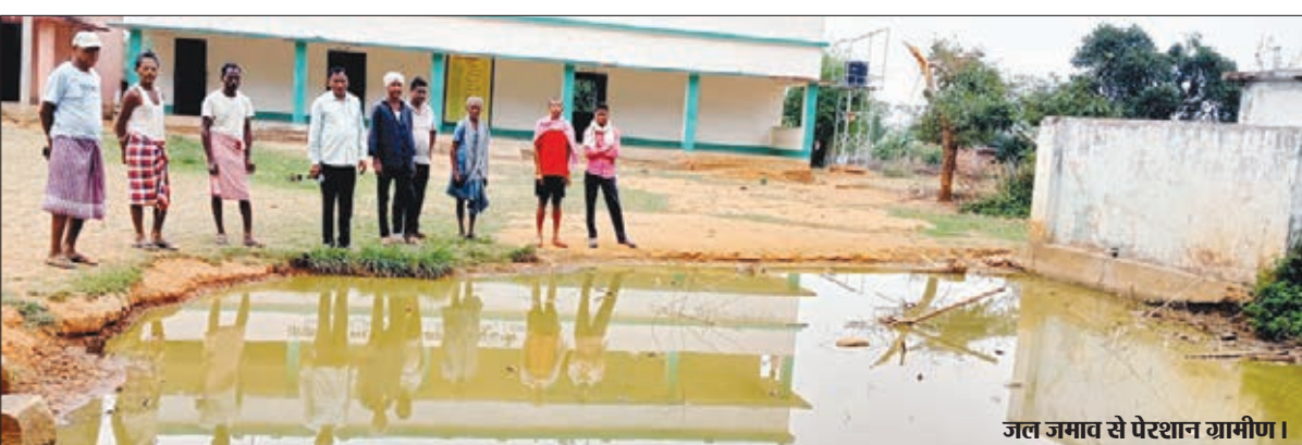
जल जमाव से परेशान ग्रामीण।

अध्वनरत छात्र-छात्रा गंदा पानी पीने को विवश हैं। साथ ही कई बीमारी फैलने की भी भय बन रहा है। जल निकासी का व्यवस्था नहीं किए जाने से ऐसा स्थिति उत्पन्न हुई है। बात यही खतम नहीं होती अच्युपकों को भी यह दंश को झेलना पड़ रहा है। गंदे पानी जमाव की नजदीक से विद्यार्थियों को आना-जाना पड़ता है। जिससे संक्रमित होने की संभवना बन सकता है। इधर विद्यालय से सटे आंगनवाड़ी केंद्र संचालित होता है। जहां पांच वर्ष से कम आयु वाले बच्चे आते हैं। जलजमाव से गहराई इतना अधिक हो गया है कि यदि कोई छोटा बच्चा डुब गया तो बड़ी अगहानी होने का का भी भय