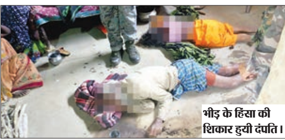
भीड़ के हिंसा की शिकार हुयी दंपति।

जंगल में भागी व पुलिस को सूचना दी। घटना की सूचना के बाद