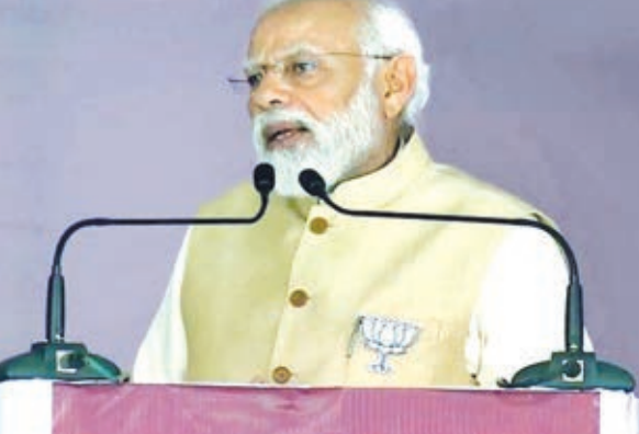
लिंगायत भाइयों और बहनों को चोर कांग्रेस ने कहा चोर

तरह के अपशब्दों की सूची बनाई और मुझे भेजा। अभी तक कांग्रेस के लोग मुझे 91 बार अलग-अलग तरह की गालियां दे चुके हैं। अगर कांग्रेस ने अपशब्दों के इस शब्दकोष पर समय व्यर्थ करने के बजाय सुशासन और अपने कार्यकर्ताओं का मनोबल बढ़ाने पर ध्यान दिया होता, तो उसकी इतनी दयनीय स्थिति नहीं होती।