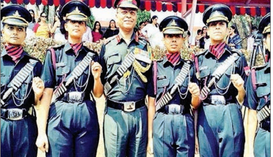
चेन्नई ओटीए में सफलतापूर्वक प्रशिक्षण पूरा करने के बाद पांच महिलाओं को मिला कमीशन।

पुरुष अधिकारियों की तरह समान अवसर मिलेंगे तथा इन्हें समान चुनौतियों का भी सामना करना पड़ेगा। इन महिला अधिकारियों को तोपखाना रेजिमेंट की सभी इकाइयों में तैनात किया जाएगा जहां इन्हें रॉकेट, मीडियम, फील्ड और सर्विलांस एंड टारगेट एक्विजिशन तथा उपकरण इकाइयों में पर्याप्त प्रशिक्षण और मौका दिया जाएगा। इन पांचों महिला अधिकारियों में से तीन को उत्तरी सीमा पर स्थित इकाइयों और दो को पश्चिमी थिएटर में चुनौतीपूर्ण स्थानों पर तैनात किया गया है। महिला अधिकारियों को तोपखाना रेजिमेंट में कमीशन दिया जाना इस बात का प्रतीक है कि सेना में बड़े स्तर पर बदलाव और सुधार किए जा रहे हैं।