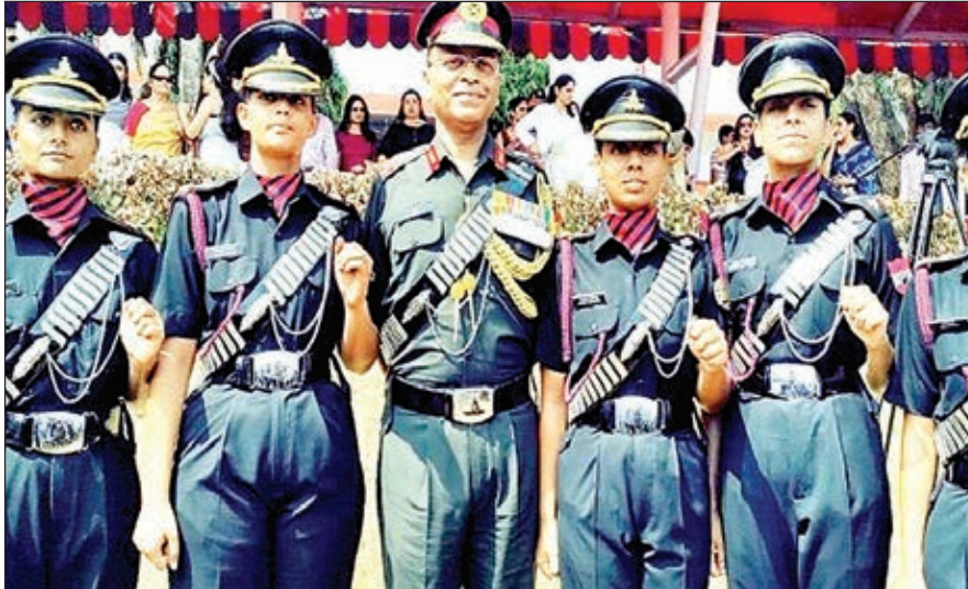
चेन्नई ओटीए में सफलतापूर्वक प्रशिक्षण पूरा करने के बाद पांच महिलाओं को मिला कमीशन।

पुरुष अधिकारियों की तरह समान अवसर मिलेंगे तथा इन्हें समान चुनौतियों का भी सामना करना पड़ेगा। इन महिला अधिकारियों को तोपखाना रेजिमेंट की सभी इकाइयों में तैनात किया जाएगा जहां इन्हें रॉकेट, मीडियम, फील्ड और सर्विलांस एंड टारगेट एक्विजिशन तथा उपकरण इकाइयों में पर्याप्त प्रशिक्षण और मौका दिया जाएगा। इन पांचों महिला अधिकारियों में से तीन को उत्तरी सीमा पर स्थित इकाइयों और दो को पश्चिमी थिएटर में चुनौतीपूर्ण स्थानों पर तैनात किया गया है। महिला अधिकारियों को तोपखाना रेजिमेंट में कमीशन दिया जाना इस बात का प्रतीक है कि सेना में बड़े स्तर पर बदलाव और सुधार किए जा रहे हैं।