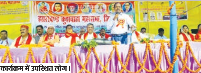
कार्यक्रम में उपस्थित लोग।