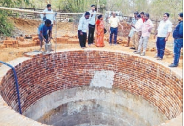
योजनाओं का निरीक्षण करते बीडीओ ।