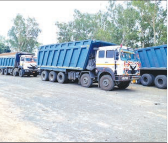
जब्त वाहन ।