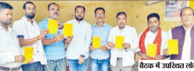
बैठक में उपस्थित लोग।