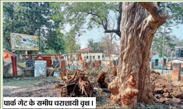
पार्क गेट के समीप धराशायी वृक्ष।

रहा है, क्योंकि जंगलों का विनाश होता जा रहा है। पेड़ को बचाने के लिए एक ओर जहां वन विभाग कागजों में करोड़ों रुपए खर्च कर रहा है। वहीं दूसरी ओर खुद ही खुलेआम जेसीबी से पेड़ों को गिराने का काम कर रहा है। यह ताजा मामला गुरुवार को देखने को मिला है। जहां बेतला नेशनल पार्क के प्रवेश द्वार के समीप वर्षों से खड़े हरे भरे विशालकाय वृक्ष को वन विभाग के अधिकारियों ने जेसीबी से गिरा दिया। जबकि सरकार ने इन्हें इन्हीं वृक्षों की रक्षा के लिए तैनात किया है। लेकिन निजी स्वार्थ के लिए वन विभाग किसी भी हद को पार करने के लिए तैयार बैठा है।