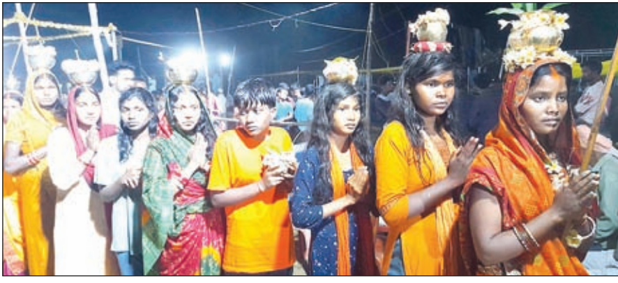
मंडा पूजा में फूलखुंदी रस्म करने जाते शिवभक्त सोकताईन।

ओरमांडी। प्रखंड क्षेत्र के श्रीश्री नर्मदेश्वर महादेव मंदिर डुंडे मनातु परिसर में आयोजित शिवभक्ति की शक्ति का परिचायक मंडा पूजा छऊ नृत्य व झूलन के साथ संपन्न हो गया। नौ दिन तक चली मंडा पूजा में ढोल-ढाक बाजे के साथ देवताओं को जगाकर गांव के 101 युवाओं ने (भोगता प्रवेश) पूजा का संकल्प लिया था। होड़ने से पूर्व सभी भोगताओं ने लोटन सेवा करते हुए मंदिर के चारों ओर परिक्रमा किए। वहीं बुधवार रात्रि में भोक्ता व सोकताईन ने नंगे पांव दहकते अंगारों में चल भगवान शिवभक्ति की शक्ति से परिचय कराया। वहीं कई भोक्ता अपने छोटे बच्चों को गोद में लेकर व कई भोक्ता बच्चे अंगारों में चले। कार्यक्रम के मुख्य