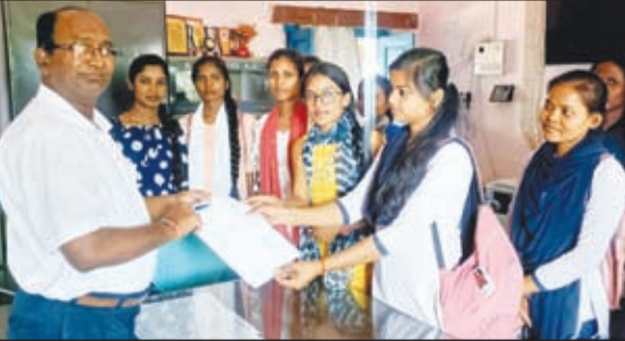
प्राचार्य को ज्ञापन सौंपती छात्राएं।

बेड़ो। रांची विश्वविद्यालय के एक गलती के कारण स्नातक पास कर चुके छात्र-छात्राओं को दो वर्ष के बाद दुबारा स्नातक जेनरिक का एग्जाम देना होगा। इधर विश्वविद्यालय द्वारा दो वर्षों के बाद फिर से स्नातक पास हुए छात्रों के एग्जाम लेने से छात्र-छात्राओं के बीच खलबली मच गई है।