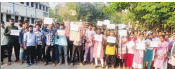
पुतला दहन करते स्टूडेंट यूनियन के सदस्य ।