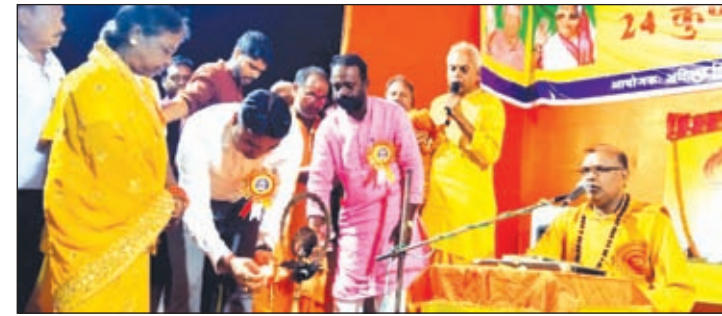
कथा प्रवचन का दीप प्रज्वलित कर उद्घाटन करते थाना प्रभारी।

बेड़ो। बेड़ो के ऐतिहासिक महादानी मैदान में अखिल विश्व गायत्री परिवार, प्रजा मंडल बेड़ो के तत्वावधान में चल रहे चार दिवसीय 24 कुंडीय नव चेतना जागरण गायत्री महायज्ञ के दूसरे दिन गुरुवार को वैदिक मंत्रोच्चार के साथ पंडाल में बने 24 कुंड में वैदिक रीति से कई अनुष्ठान व हवन-पूजन किया गया। महायज्ञ में आहुति