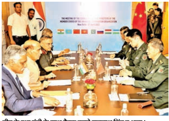
चीन के रक्षा मंत्री के साथ बैठक करते राजनाथ सिंह व अन्य।

राजनाथ सिंह ने चीन के रक्षा मंत्री ली शांगफू से कहा-सीमा पर अमन-चैन बहाल हो