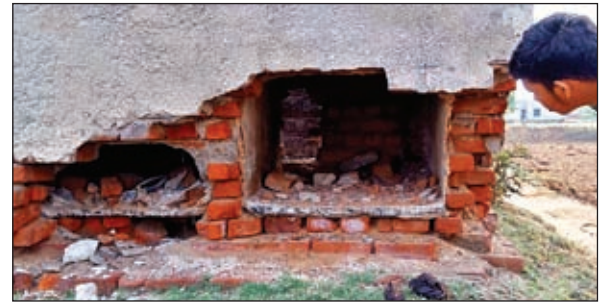
तोड़ी गयी सदमा स्कूल भवन की दीवार।

ओरमांडी। प्रखंड क्षेत्र स्कूल को चोरों द्वारा लगातार निशाना बनाया जा रहा है। खास कर सदमा क्षेत्र के स्कूलों में लगातार चोरी की घटना हो रही है। वहीं प्रोजेक्ट हाई स्कूल सदमा की स्कूल भवन की दीवार तोड़ व स्फूली बच्चों के लिए लगे नलों को भी तोड़ दिया गया। असामाजिक तत्वों द्वारा घटना को अजाम दिए जाने की आशंका जताते हुए ओरमांडी थाना में मामला दर्ज कराया गया है। पुलिस द्वारा मामले की छानबीन की जा रही है।