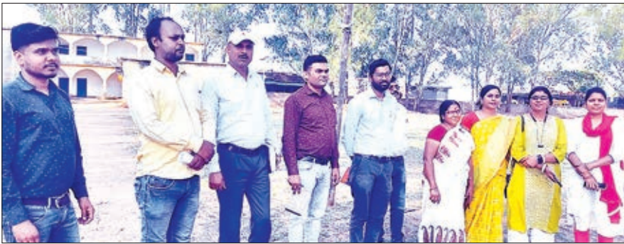
झारखंड बालिका आवासीय विद्यालय का निरीक्षण करने पहुंची शिक्षा विभाग की टीम।

उन्होंने बताया कि सभी विद्यालयों में नया मेन्सू लागू किया