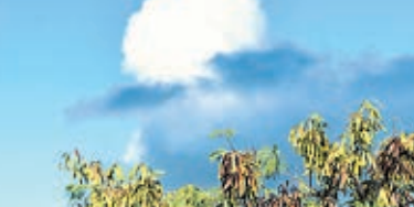
खुशनुमा बना रहेगा। इस दौरान राज्य के अलग-अलग हिस्सों में बारिश होगी। वहीं कुछ इलाकों में बादल छाये रहेंगे। विभाग की मानें तो आने वाले चार दिनों तक राज्य के तापमान में वृद्धि की संभावना नहीं है। 30 अप्रैल के बाद तापमान में वृद्धि दर्ज की जा सकती है। जो चार से पांच डिग्री सेल्सियस तक होगी। बुधवार को भी राज्य के कई जिलों में बारिश हुई है।

रांची। राज्यवासियों को आने वाले कुछ दिनों तक गर्मी से राहत मिलेगी। मौसम विज्ञान विभाग के अनुसार 30 अप्रैल तक राज्य में मौसम