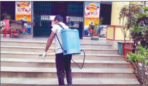
विद्यालय परिसर को सैनिटाइज करता कर्मचारी।

148 छात्राओं के कोरोना पॉजिटिव होने की पुष्टि हुई है। सभी छात्राओं को स्कूल में ही कोरोना प्रोटोकॉल के साथ आईसोलेट किया गया है। साथ ही स्कूलों को पूरी तरह से आज सैनिटाइज भी कराया गया।