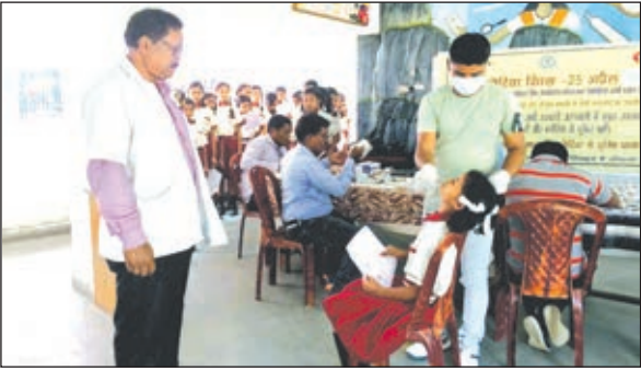
एक छात्रा की जांच करती मेडिकल टीम।

148 छात्राओं के कोरोना पॉजिटिव होने की पुष्टि हुई है। सभी छात्राओं को स्कूल में ही कोरोना प्रोटोकॉल के साथ आईसोलेट किया गया है। साथ ही स्कूलों को पूरी तरह से आज सैनिटाइज भी कराया गया।