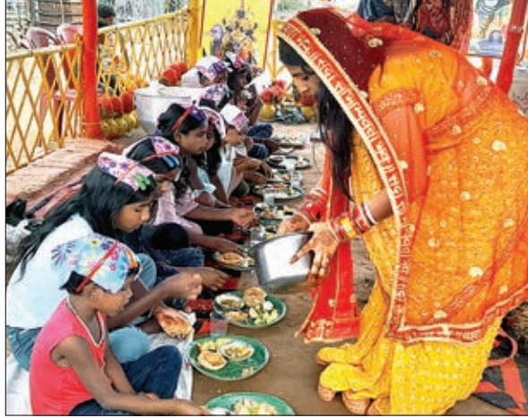
कन्याओं के साथ पूजा में शामिल भक्तगण।