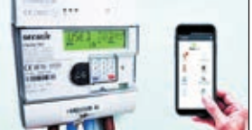
रुपये की स्वीकृति दे दी है। झारखंड बिजली वितरण निगम की मानें तो आने वाले एक साल में राज्य भर में स्मार्ट मीटर लगाये जाने हैं। इसके लिए 800 करोड़ रुपए खर्च होंगे, जिसकी स्वीकृति केंद्रीय उर्जा मंत्रालय ने दी है। राज्य में 13.41

रांची। राज्य में बिजली व्यवस्था दुरुस्त करने के लिए स्मार्ट मीटर लगाने की प्रक्रिया जारी है। अभी राजधानी रांची में स्मार्ट मीटर लगाये जा रहे हैं। जमशेदपुर, धनबाद में भी स्मार्ट मीटर लगाये जाने की प्रक्रिया चल रही है। आने वाले समय में राज्य भर में स्मार्ट मीटर लगाये जायेंगे। इसके लिए केंद्र सरकार ने राज्य को 800 करोड़