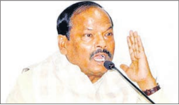
पूर्व सीएम रघुवर दास की फाइल फोटो।