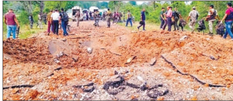
पूरा देश दुखी : दंतेवाड़ा नक्सली हमले से पूरा देश शोक में डूब गया है। नक्सलियों की इस कारगराना हरकत की हर ओर निंदा हो रही है। पीएम मोदी ने हमले पर दुख जताया और शहीद जवानों को श्रद्धांजलि दी है। सीएम भूपेश बघेल ने कहा कि नक्सलियों को बख्शा नहीं जायेगा। पीएम नरेंद्र मोदी ने ट्वीट कर इस घटना की कड़ी निंदा की है। हमले में शहीद बहादुर जवानों को श्रद्धांजलि अर्पित करता हूँ। उनके बलिदान हमेशा याद रखा जायेगा। राहुल गांधी ने भी दुःख जाहिर कर शहीद जवानों को श्रद्धांजलि दी है।

हमला उस वक्त हुआ, जब मिनी बस में जवान सवार होकर अपने साथियों की मदद के लिए जा रहे थे। उसी दौरान नक्सलियों ने ब्लास्टर कर पुलिस जवान