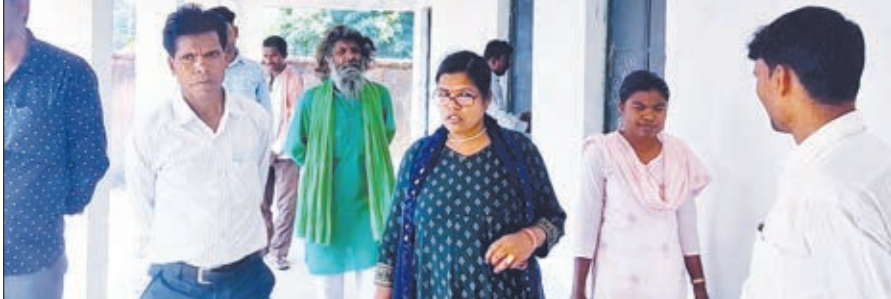
निरीक्षण करते राष्ट्रीय मानवाधिकार संगठन के सदस्य।