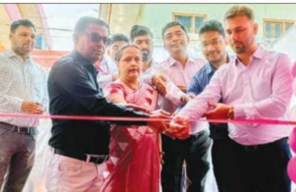
हौंडा सर्विस एंड स्पेयर्स का उद्घाटन करते अतिथि।