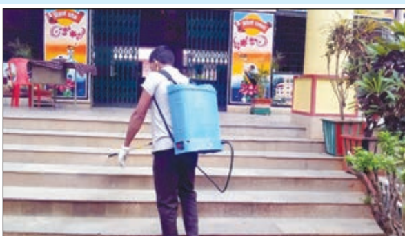
विद्यालय परिसर को सैनिटाइज करता कर्मचारी।

148 छात्राओं के कोरोना पॉजिटिव होने की पुष्टि हुई है। सभी छात्राओं को स्कूल में ही कोरोना प्रोटोकॉल के साथ आईसोलेट किया गया है। साथ ही स्कूलों को पूरी तरह से आज सैनिटाइज भी कराया गया।