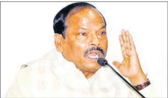
पूर्व सीएम रघुवर दास की फाइल फोटो।