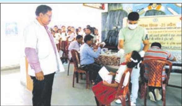
एक छात्रा की जांच करती मेडिकल टीम।

148 छात्राओं के कोरोना पॉजिटिव होने की पुष्टि हुई है। सभी छात्राओं को स्कूल में ही कोरोना प्रोटोकॉल के साथ आईसोलेट किया गया है। साथ ही स्कूलों को पूरी तरह से आज सैनिटाइज भी कराया गया।