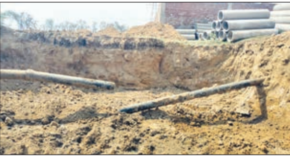
शक्तिगस्त जलापूर्ति पाईप