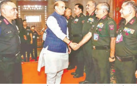
विचार किया जा रहा है। जम्मू कश्मीर का जिक्र करते हुए रक्षा मंत्री सिंह ने कहा कि वहां शांति और स्थिरता है एवं केंद्रशासित प्रदेश में आतंकवादी गतिविधियों की संख्या में उल्लेखनीय गिरावट आई है। उन्होंने कहा कि पूर्वोत्तर राज्यों में भी, भारतीय थल सेना द्वारा चलाए गए अभियानों के बाद आंतरिक सुरक्षा स्थिति में काफी सुधार हुआ है। सिंह ने कहा कि इसके बाद भी, हमें शांति के लिए

को एलएसी की सुरक्षा के लिए लगातार सतर्कता बरतनी होगी। रक्षा मंत्री की यह टिप्पणी पूर्वी लद्दाख में तीन साल से चल रहे सीमा विवाद की पृष्ठभूमि में है। उन्होंने कहा कि देश की सुरक्षा सरकार की शीर्ष प्राथमिकता है। उन्होंने कहा कि मैं आप सभी को विश्वास दिलाता हूँ कि सरकार का भरसक प्रयास है कि सीमा पर तैनात हर जवान को अत्याधुनिक हथियार और सुविधाएं मुहैया कराई जाएं। सेना के कमांडरों का पांच दिवसीय सम्मेलन सोमवार को दिल्ली में शुरू हुआ। इसमें चीन और पाकिस्तान के साथ सीमाओं पर देश की राष्ट्रीय सुरक्षा चुनौतियों और बल की युद्धक क्षमता में वृद्धि के तौर-तरीकों पर