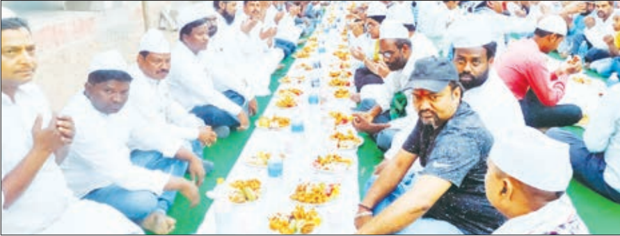
इफ्तार में शामिल लोग।