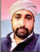
खबर मन्त्र संवाददाता

सिर्फ भूखे प्यासे रहने का नाम रोजा नहीं है। दुनियावी मोह माया छोड़ कर इबादत और ईसानियत की खिदमत को अंजाम देना ही रमजान का असल मकसद है। रमजान में किए गए हर अमल का