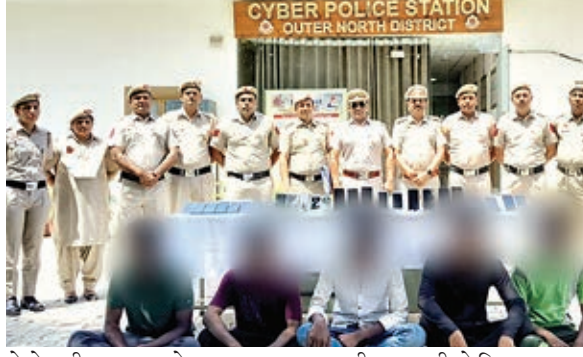
ने बेहतरीन काम करते हुए सूझबूझ से चिटिंग के अमाउंट को पहले रोका और उसे फिर टेक्निकल सर्विलांस की मदद से वापस करने में कामयाबी पाई। फिर चिटिंग के मामले को दर्ज कर पुलिस टीम जब