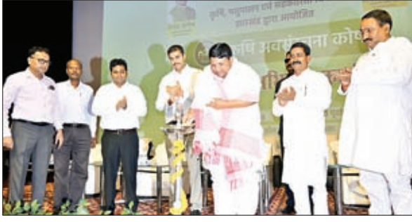
जागरूकता अभियान का शुभारंभ करते कृषि मंत्री व अन्य

रहे हैं। आने वाले दिनों में जिला कृषि क्षेत्र में कई उपलब्धियां हासिल करने वाली है। कृषकों का आंकड़ा हमारे पास मौजूद है। आंकड़े की मदद से हम योजना बना पा रहे हैं। स्थानीय लोगों को योजनाओं से लाभान्वित कर पा रहे हैं। किसानों को मदद प्रदान करने के लिए उदाहरण से पता चलता है जो किसान पहले थोड़े फसल के मालिक होते थे। अब वे बहुत जागरूक हैं एवं सरकारी योजनाओं का लाभ भी प्राप्त कर रहे हैं। यहां पर मिल की कमी है। जिसको लेकर सरकार ने उद्योग विभाग से बात कर नहीं मिल स्थापित करने की भी बात की है। कृषक बेहतर