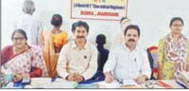
सुनवाई करते सीडब्ल्यूसी सदस्य

दुमका। मंगलवार को बाल कल्याण समिति ने दो ऐसे बालक-बालिकाओं का