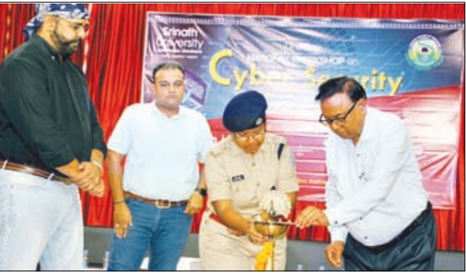
सेमिनार का उद्घाटन करती साइबर डीएसपी व अन्य अतिथिगण।

और ठगों से बचा कर रखना ही साइबर सिक्वोरिटी है। क्योंकि आज के समय में हमारी कई चीजें डेटा के रूप में होती हैं इसलिए ऐसे संवेदनशील डाटा को बचा कर रखना आवश्यक होता है। साइबर