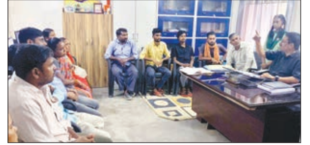
राजकीय मध्य विद्यालय पंडरा में परेंट्स के साथ बच्चों की हुई मीटिंग