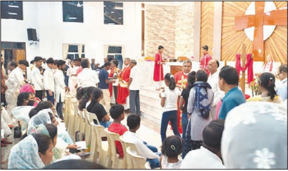
गोलमुरी चर्च में गुड फ्राइडे को जमा मसीही समुदाय।