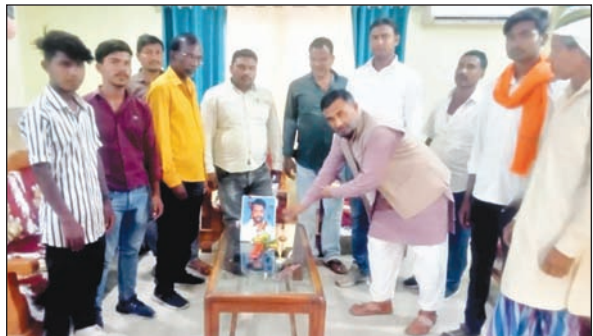
श्रद्धांजलि अर्पित करते जेएमएम कार्यकर्ता।

बरवाडीह। राज्य के शिक्षा मंत्री टाइगर जगन्नाथ महतो के निधन पर पूरे देश के राजनीतिक गलियारों में शोक की लहर है। जगह- जगह श्रद्धांजलि समारोह का आयोजन कर दिवंगत नेता को श्रद्धांजलि दी जा रही है। इसी बीच झारखण्ड मुक्ति मोर्चा बरवाडीह प्रखण्ड कमेटी के द्वारा शुक्रवार को प्रखण्ड के बेतला में शोकसभा का आयोजन कर श्रद्धांजलि अर्पित की गई। कार्यकर्ताओं ने उनके छाया