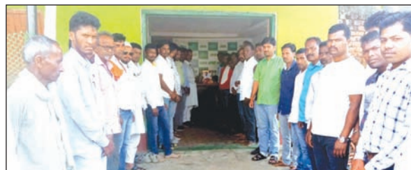
श्रद्धांजलि देते झामुमो कार्यकर्ता।