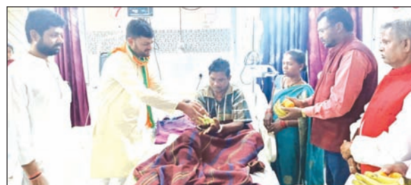
फल वितरण करते भाजपा कार्यकर्ता।

इस अवसर पर लातेहार भाजपा की पूरी टीम सदर अस्पताल में मरीजों के बीच पहुंची एवं उनका हाल जाना तथा उन्हें फल सामग्रियां उपलब्ध कराई। उक्त कार्यक्रम में मुख्य अतिथि के रूप में भाजपा जिला अध्यक्ष सह मनिंका