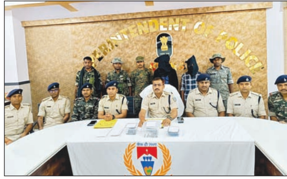
प्रेस वार्ता कर जानकारी देते एसपी व अन्य।