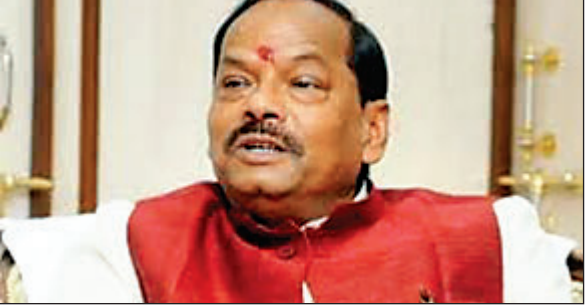
पूर्व मुख्यमंत्री रघुवर दास।

जमशेदपुर। पूर्व मुख्यमंत्री रघुवर दास ने टाटा स्टील के सीईओ एवं प्रबंध निदेशक टीवी नरेंद्रन को पत्र लिखकर कंपनी द्वारा वित्तीय वर्ष 23-24 के लिए बनायी जाने वाली विकास योजनाओं में जमशेदपुर पूर्वी विधानसभा क्षेत्र पर विशेष ध्यान देने का आग्रह किया है। उन्होंने कंपनी प्रबंधन द्वारा प्रत्येक वित्तीय वर्ष में जमशेदपुर के नागरिकों को दी जाने वाली विशेष सुविधाओं की सराहना करते हुए कहा है कि वे चाहते हैं कि वित्तीय वर्ष 2023-24 की योजनाओं में गैर कंपनी क्षेत्रों के मनीफौट, मोहरदा, नामदा बस्ती, महानंद बस्ती, हरिजन बस्ती में घर-घर जलापूर्ति की जाए। उन्होंने कहा है कि केबुल टाउन बस्ती में कंपनी द्वारा लोगों से पानी का बिल व्यक्तिगत तौर पर लिया जाता है,