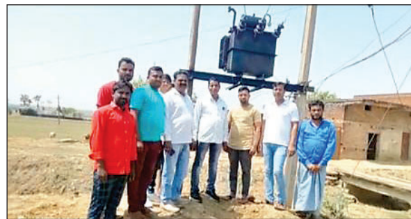
मौके पर मौजूद लोग।