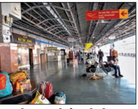
कुडमी समाज के रेल रोकों आंदोलन के चलते सुनसान पड़ा टाटानगर स्टेशन।