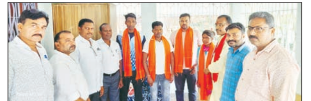
सम्मान समारोह में शामिल लोग।