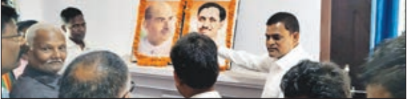
स्थापना दिवस मनाते भाजपा कार्यकर्ता