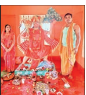
जन्मोत्सव मनाते भक्त