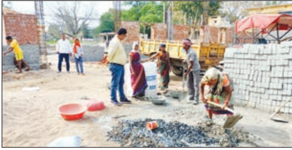
मेटरियल में भी बरती जा रही है अनियमितता