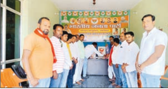
स्थापना दिवस मनाते लोग