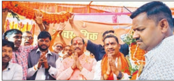
पूर्व मुख्यमंत्री का स्वागत करते कार्यकर्ता

भवनाथपुर। पूर्व मुख्यमंत्री व भाजपा के राष्ट्रीय उपाध्यक्ष रघुवर दास का भवनाथपुर में अलग-अलग जगहों पर कार्यकर्ताओं एवं व्यापारियों ने जोरदार स्वागत किया। इस दौरान पूर्व सीएम को फूलमाला, पगड़ी व शल भेंट किया गया। मौके पर व्यवसायी संघ ने भवनाथपुर बाजार में पूर्व सीएम एवं व्यायक