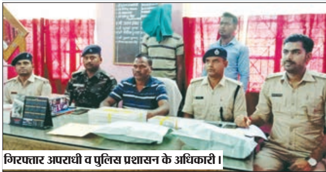
गिरफ्तार अपराधी व पुलिस प्रशासन के अधिकारी।

कुचिला ग्राम के लाहीवार टोला का रहने वाला है हत्या में प्रयुक्त हथियार