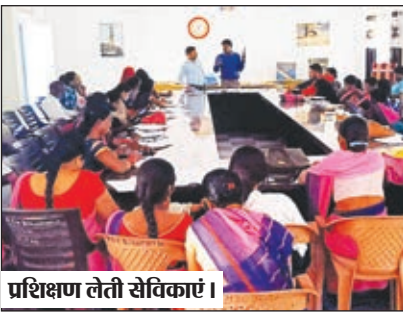
प्रशिक्षण लेती सेविकाएं।