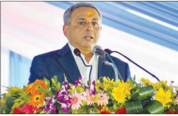
भूमि पूजन समारोह को संबोधित करते टाटा स्टील के सीडिओ टीवी नरेंद्रन।

कुछ वर्ष पूर्व नयी दिल्ली में आयोजित झारखंड इन्वेस्टमेंट्स मीट में हमलोगों ने टिनप्लेट कंपनी के विस्तार के लिए एम.ओ.यू. किया था जिसे आज धरातल पर उतारा जा रहा है। टाटा स्टील आने वाले दिनों में झारखंड स्थित डाउन स्टीम इंडस्ट्री में निवेश करना जारी रखेगी। हम इस सेगमेंट में टीसीआईएल की बड़ी भूमिका