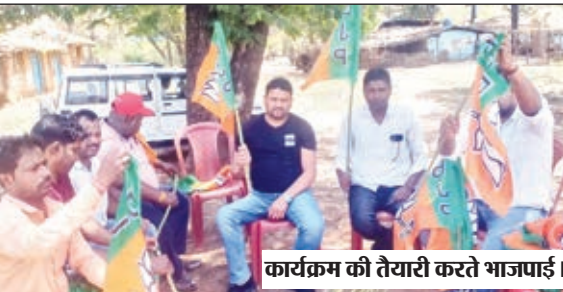
कार्यक्रम की तैयारी करते भाजपाई।

बरवाडीह। झारखण्ड के पूर्व मुख्यमंत्री और भाजपा के राष्ट्रीय उपाध्यक्ष रघुवर दास का आगमन आज मंगलवार की दोपहर में बरवाडीह प्रखंड के छिपादोहर मंडल अंतर्गत गांधी मैदान में होने जा रहा है। इस कार्यक्रम को लेकर भाजपा कार्यकर्ताओं का उत्साह चरम पर है। कार्यक्रम की सभी तैयारियां पूरी कर ली गई है। पूरे छिपादोहर में बाजार से लेकर पेट्रोल पंप तक भाजपा का झंडा पाट दिया गया है। पूरी जानकारी देते हुए सांसद प्रतिनिधि अजय सोनी ने बताया कि पूर्व मुख्यमंत्री रघुवर दास के कार्यक्रम को लेकर सभी तैयारियां लगभग पूरी कर ली गई है, मंच और पंडाल तैयार हो चुका है। कार्यक्रम में जिले से