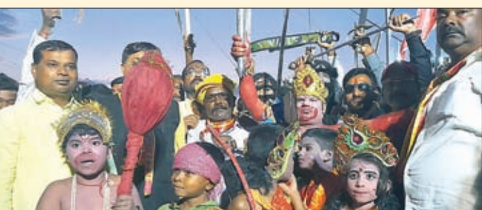
श्रीराम-लक्ष्मण, भरत, शत्रुघ्न और जानकी का रूप धारण किए बच्चे।