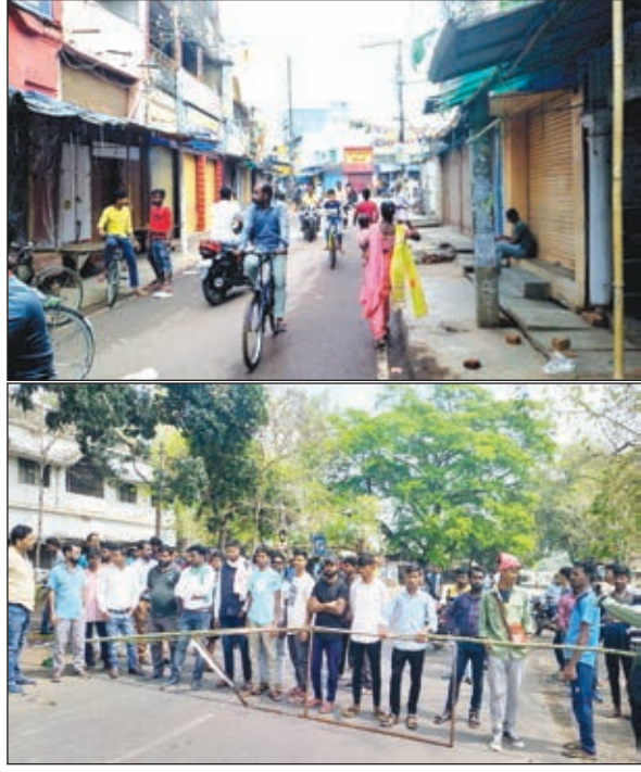
खबर मन्त्र संवाददाता

करने की मांग कर रहे हैं। शहर के बाजार, सब्जी मार्केट और बस स्टैंड पूरी तरह बंद रहा। छात्रों का आरोप है कि राज्य बने 22 वर्ष से ज्यादा बीत गए। लेकिन अभी तक किसी भी सरकार ने स्पष्ट स्थानीय और नियोजन नीति लागू नहीं की है। जिसका खामियाजा छात्रों को भुगतना पड़ रहा है। छात्र पढ़ाई करते-करते बूढ़े हो जा रहे हैं लेकिन उन्हें नौकरियां नहीं मिल रही है। यह सामाजिक ताना छात्रों को सुनना पड़ रहा है। आने वाली पीढ़ी को भी यह ताना नहीं सुनना पड़े इसलिए छात्र सड़कों पर हैं और सरकार को चेतावनी भी दे रहे हैं। इस अवसर पर छात्र नेता