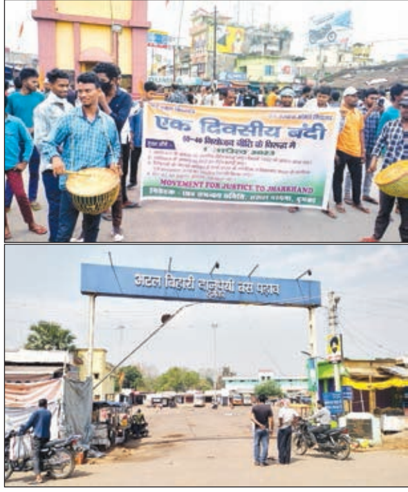
खबर मन्त्र संवाददाता

दुमका। खतियान आधारित स्थानीय और नियोजन नीति की मांग को लेकर सिंदो कान्हु मुमुं विश्वविद्यालय छात्र समन्वय समिति द्वारा 1 अप्रैल को संचाल परगना प्रमंडल बंद सफल रहा। बंद का दुमका सहित पूरे प्रमंडल में बंद का व्यापक असर देखा गया है। दुमका की सड़कों पर सुबह से ही काफी संख्या में छात्र उतर कर आवागमन को पूरी तरह बाधित किए हुए हैं। विभिन्न चौक चौराहों पर छात्रों की टोली सड़कों पर बैठकर सरकार के खिलाफ जमकर नारेबाजी कर रहे हैं और खतियान आधारित स्थानीय और नियोजन नीति लागू