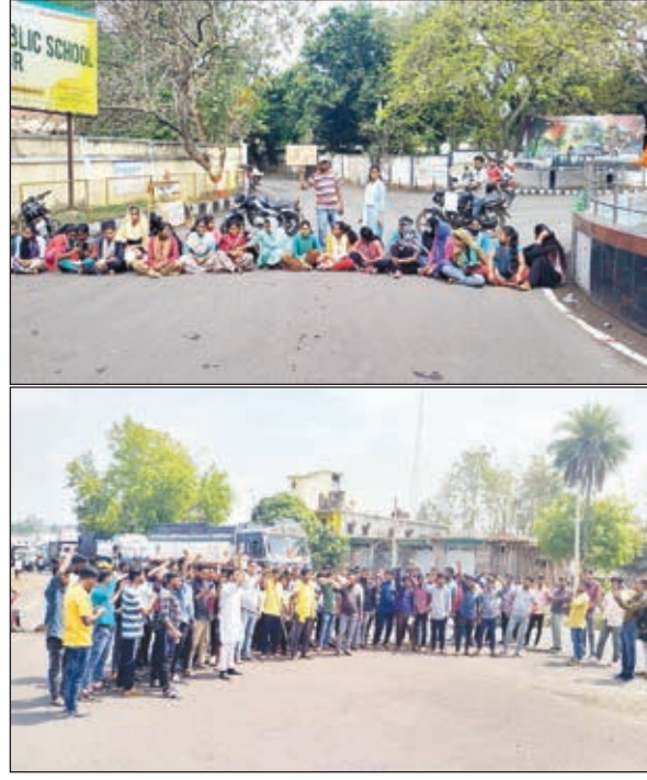
खबर मन्त्र संवाददाता

नियोजन नीति नहीं लागू होने सहित अन्य मांगों को लेकर अनिश्चितकालीन आर्थिक नोकबंदी करेंगे। एसडीएम कौशल कुमार ने बताया कि बंद से इमरजेंसी सेवा दूर रही। एम्बुलेंस