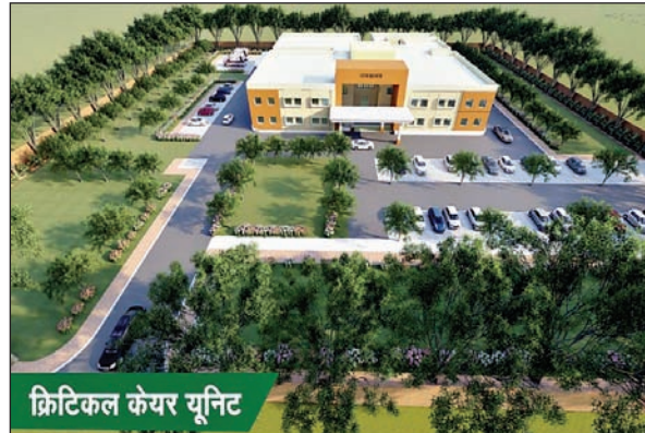
क्रिटिकल केयर यूनिट