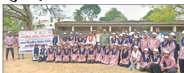
कॉलेज प्रशासन व एनएसएस इकाई के स्वयंसेवक