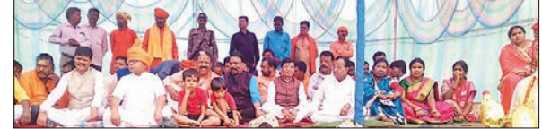
खबर मन्त्र संवाददाता

कैरो। ऐतिहासिक भरत मिलाप सह दशमी मेला का आयोजन प्रखंड मुख्यालय स्थित बजरंगबली मेला टांड में किया गया। जिसमें अलग अलग जगहों से सैकड़ों की संख्या में अखाड़े पहुंचकर बैड, ताशा, ढोल, नगाड़े, कैसीओ बाजा के साथ रामभक्त जय श्री राम, हर हर महादेव, हिन्दू अखाड़ा जिंदाबाद राम लखन जान की जय बोली हनुमान की जयकारे से पूरा प्रखंड क्षेत्र गुंजायमान रहा। महावीर मंडल कैरो द्वारा सभी अखाड़ों के बीच कलाबाजियां दिखाने के बाद प्रथम, द्वितीय, तृतीय,चतुर्थ पुरस्कार के