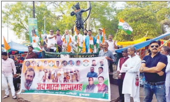
नुककड़ सभा को संबोधित करते कांग्रेसी नेता