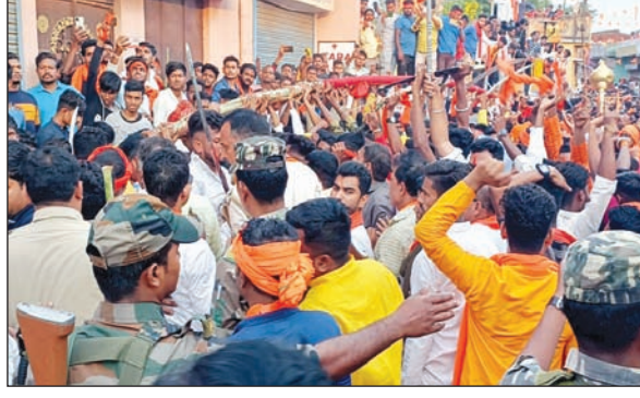
इसी ठेला-ठेली में टूटा झंडा, घायल

में शुकुवार अपराह्न चार बजे मुख बाजार स्थित हनुमान मंदिर से हजारों रामभक्तों के संग निकला। मुख्य पथ,चावल बाजार, दुर्गा मंदिर, कीर्तन पाड़ा होते हुए तय रुट रंकिणी मंदिर तक जुलूस खेल करतब दिखाते हुए पहुंचा। निर्धारित स्थान पर झंडा खड़ा करने के दौरान झंडा को आगे बढ़ने से रोकने हेतु झंडा के अगले भाग को पकड़ने और पीछे से दबाव देने से 30 फीट लंबे रामनवमी झंडा का अगला तीन चार फीट हिस्सा टूट गया। विवाद यहीं से शुरू हुआ। अखाड़ा कमेटी द्वारा मौके पर उपस्थित प्रशासन के