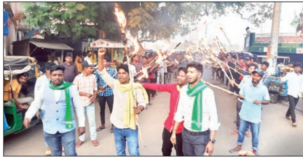
मशाल जुलूस निकालते छात्र समन्वय समिति

जुलूस सिदो कान्हू चौक (पोखरा चौक) से निकाल टीन बाजार होते हुए नीचे बाजार होते हुए वीर कुर्ब सिंह चौक पहुंच सभा में तब्दील हो गई। समन्वय समिति ने सरकार के 60-40 के अनुपात में नियोजन नीति पर सवाल खड़ा किया है। समिति ने तत्काल प्रभाव से नियोजन नीति रद्द करते हुए 1932 खतियान आधारित स्थानीयता नीति बनाने की मांग की है। साथ ही