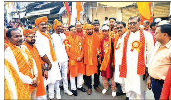
खबर मन्त्र संवाददाता

लिए अलग-अलग चेंजिंग रूम हैं, जो सभी खिलाड़ियों के लिए सर्वोत्तम संभव अनुभव सुनिश्चित करते हैं। नए निर्मित सुविधा अब शहर में राष्ट्रीय स्तर के टूर्नामेंट की मेजबानी का मार्ग प्रशस्त करेगी। टाटा स्टील बैडमिंटन ट्रेनिंग सेंटर सभी खेल प्रेमियों के लिए बेहतरीन माहौल प्रदान करने के लिए तैयार है। वर्तमान में, टाटा स्टील बैडमिंटन ट्रेनिंग सेन्टर में कुल 491 खिलाड़ी पंजीत हैं। टाटा स्टील खेलों की प्रबल समर्थक है और कल के एथलीटों को विश्व स्तरीय बुनियादी सुविधा प्रदान करने की दिशा में लगातार काम कर रही है।