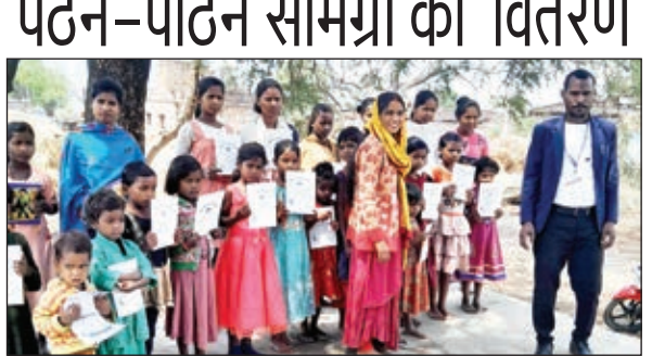
वितरण करते ट्रस्ट जिला प्रभारी