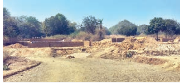
इसी स्थान पर संचालित है अवैध ईट भट्ठा

चैनपुर। चैनपुर प्रखंड के लंगड़ा मोड़ तथा उसके आस पास कई जगहों पर बिना किसी अनुमति के नियमों को ताक में रखकर सरकारी व निजी जमीन में अवैध तरीके से बे रोक टोक ईट बनाने का धंधा चल रहा है। ईट बनाने के क्रम में पर्यावरण को प्रदूषित किया जा रहा है। वहीं इस कारोबार से लाखों रुपए की रायल्टी का चुना तो लग रहा है,