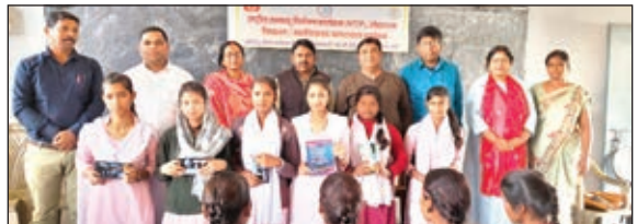
विजयी प्रतिभागी के साथ अतिथि