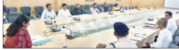
बैठक करती डीडीसी

सेवन से संबंधित जिला में कार्रवाई की गई है। जिसमें अब तक कुल छह: तरह के प्रतिबंधित पान मसाला विक्रेताओं पर कुल 52 हजार रुपए का जुर्माना किया जा चुका है। खाद्य सुरक्षा अधिनियम के उल्लंघन के आलोक में जिला में कुल 14 खाद्य कारोबारियों पर जुर्माना किया गया है जिसमें साफ-सफाई में अनियमितता पाये जाने वाले 09 कारोबारियों पर 48 हजार रुपए का जुर्माना, मिठाई में अखाद्य रंगों का प्रयोग करनेवाले 02 कारोबारियों पर चार हजार रुपए का जुर्माना और गलत फूड प्रोडक्ट