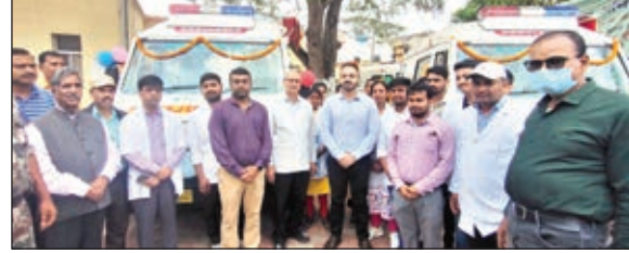
शुभारंभ करते डीसी

कुर्दू, भण्डरा और सदर प्रखण्ड के 20-20 राजस्व ग्रामों में लोगों को चिकित्सीय जांच, इलाज व दवाओं की निःशुल्क सुविधा मुहैया करायी जाएगी। इस मेडिकल वैन में मेडिकल अफसर, फार्मासिस्ट, लैब तकनीशियन और एनएम की टीम रहेगी जो प्रतिदिन गांव-गांव जाकर मरीजों की जांच, इलाज के साथ-