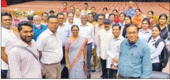
कन्वेंशन सेंटर में उपस्थित कुलपति व छात्र-छात्राएं