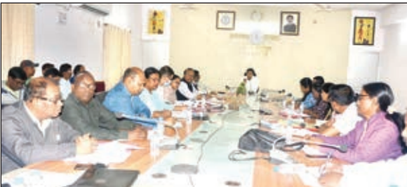
बैठक में निर्देश देते उपायुक्त व उपस्थित स्वास्थ्य विभाग के पदाधिकारी

गुमला। उपायुक्त सुशांत गौरव की अध्यक्षता में सोमवार को स्वास्थ्य विभाग की समीक्षा बैठक हुई। बैठक में मुख्य रूप से जिले में चल रही विभिन्न स्वास्थ्य संबंधी योजनाओं एवं कार्यों की समीक्षा की गई। सीजनल इन्फ्लूएंजा ( एच1 एन1, एच3 एन3 ), टीबी उन्मूलन, कुपोषण उन्मूलन, 15वें वित्त आयोग अंतर्गत बनाये जाने वाले हेल्थ सबसेंटर आदि को लेकर विभिन्न निर्देश दिए गए। उपायुक्त ने लंबित कार्यों को जल्द से जल्द पूर्ण करने का निर्देश दिया। बैठक में उपस्थित सिविल सर्जन द्वारा सीजनल इन्फ्लूएंजा के संबंध में जानकारी दी एवं जिले में इसके बचाव के संबंध में बताया। उन्होंने बताया कि यह