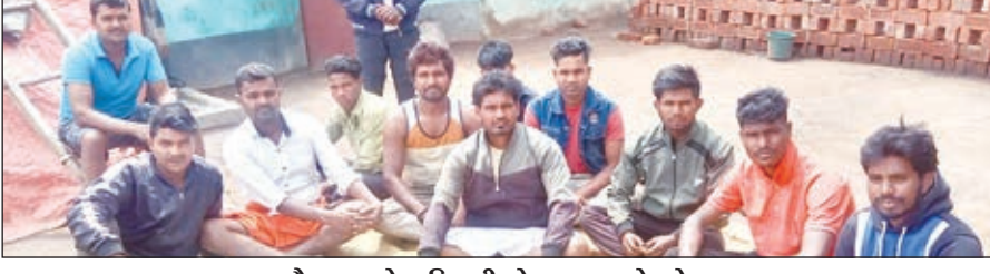
बैठक करते आदिवासी लोहरा समाज के लोग