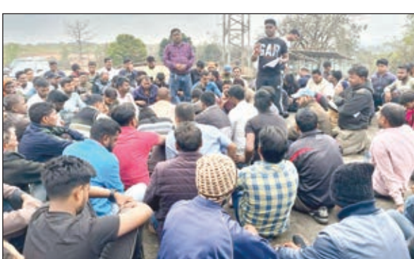
बैठक करते लोग

सहमती बनी। जिन-जिन ट्रांसपोर्टरों द्वारा भाड़ा बढ़ाने पर सहमति दी गयी उनका लोडिंग कार्य शुरू कर दिया गया। जिसमें ऑडिशा मेटालिक का 2000, कुसमाही साइडिंग का 650, रामगढ़ का 1200, जमरिया का 2000 प्रति टन भाड़ा देने पर सहमति बनी। वहीं सेल कोयला का भी दूरी के हिसाब से भाड़ा तय किया गया और ट्रांसपोर्टिंग कार्य शुरू कर दिया गया। बता दें कि भाड़ा वृद्धि की मांग को लेकर विस्थापित प्रभावित ट्रक