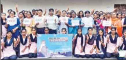
कार्यशाला में शामिल छात्र-छात्राएं एवं शिक्षक